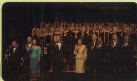
อธิการบดี และคณะผู้บริหารมหาวิทยาลัยบูรพา ร่วมร้องเพลง บูรพาคือตะวันฉาย