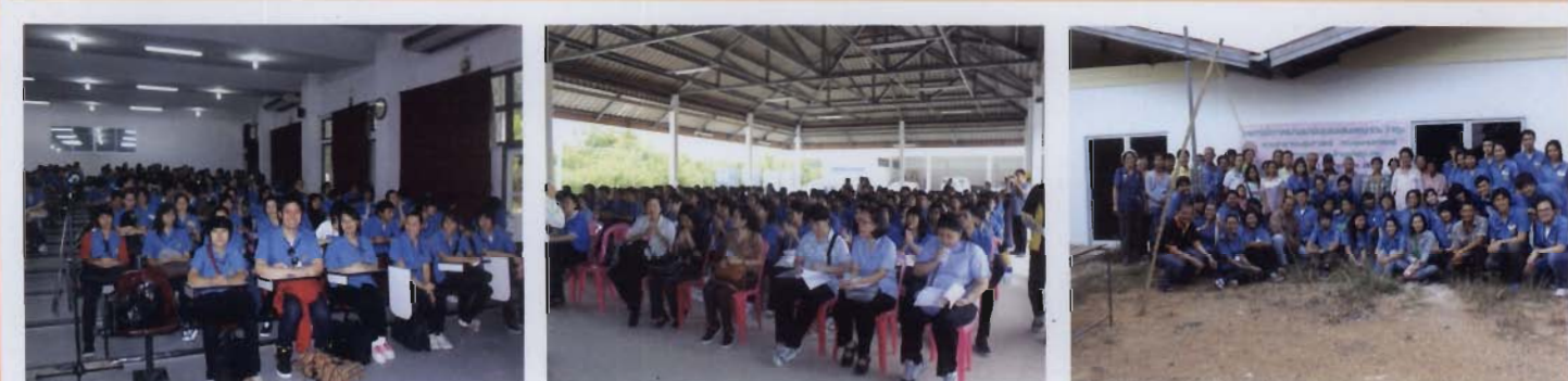
มหาวิทยาลัยบูรพา “สร้างคนคุณภาพ สร้างปัญญาให้แผ่นดิน”

ทั้งสิ้น ๒๑๒ คน การฝึกภาคสนามอนามัยชุมชนในครั้งนี้มีวัตถุประสงค์เพื่อให้นิสิตสามารถบูรณาการความรู้ที่ได้ศึกษาจากมหาวิทยาลัยมาประยุกต์ให้เข้ากับการปฏิบัติจริงในชุมชน เพื่อสร้างเสริมประสิทธิภาพตรงในการทำงานตามสาขาวิชาชีพ เกิดการทำงานเป็นทีม มีประสิทธิภาพในการร่วมฝึกปฏิบัติการกับนิสิตต่างสาขาวิชาชีพ มีการแลกเปลี่ยนประสบการณ์ในการดูแลสุขภาพร่วมกัน โดยกระบวนการมีส่วนร่วมของประชาชน และประยุกต์ใช้การประสานงานร่วมกับหน่วยงานที่เกี่ยวข้องในพื้นที่ เพื่อจัดทำโครงการในการแก้ไขปัญหาสุขภาพและสาธารณสุข โดยมีระยะเวลาในการฝึกปฏิบัติการในพื้นที่หมู่ ๕, ๖ และ ๗ ของตำบลพลวงทอง อำเภอบ่อทอง จังหวัดชลบุรี มีระยะเวลาจำนวน ๗ วัน มีกำหนดการฝึกปฏิบัติระหว่างวันที่ ๒๖ มีนาคม - ๑ เมษายน พ.ศ. ๒๕๕๕