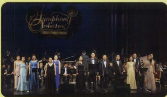
ผศ.ดร.บรรพต วิฑูรราช รองอธิการบดีฝ่ายกิจการพิเศษ และคณบดีวิทยาลัยพาณิชยศาสตร์ พร้อมด้วยผู้บริหารวิทยาลัยและหัวหน้างานประชาสัมพันธ์ ร่วมร้องเพลงประสานเสียง