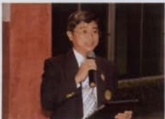
ผศ.ดร.วิโรจน์ เรืองประทีปสุข รองอธิการบดีฝ่ายบริหาร