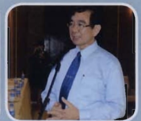
ศ.นพ.สมพล พงศ์ไทย อธิการบดี