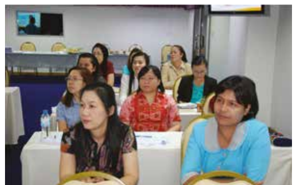
มหาวิทยาลัยบูรพา “สร้างคนคุณภาพ สร้างปัญญาให้แผ่นดิน”