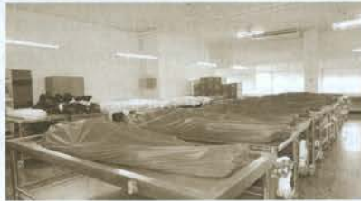
พิธีทำบุญอุทิศส่วนกุศลแก่ผู้อุทิศร่างกายเพื่อการศึกษา ประจำปีการศึกษา 2553 ณ อาคารวิทยาศาสตร์การแพทย์ คณะสหเวชศาสตร์ มหาวิทยาลัยบูรพา จ.ชลบุรี เมื่อวันที่ 5 มิถุนายน 2553