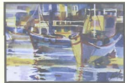
ผลงานเทคนิคสีน้ำ ศาสตราจารย์สุชาติ เกาทอง