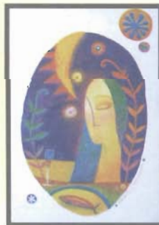
ผลงานเทคนิคผสม ผศ.จักรกริณี บัวแก้ว