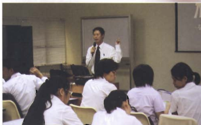
คณบดีสอนวิชา บทนำสู่วิชาชีพเภสัชกรรม