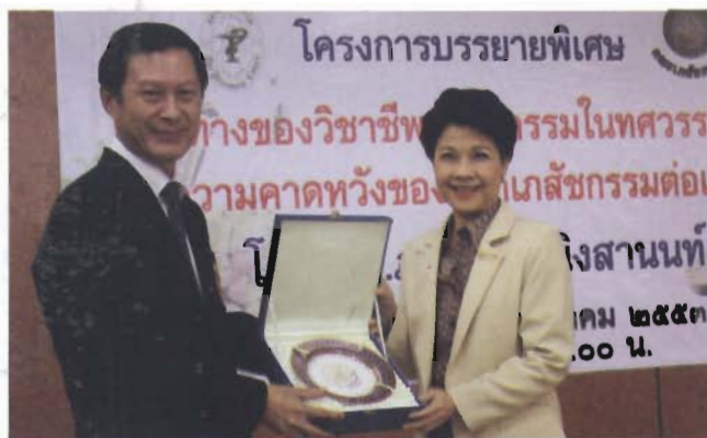
คณบดีคณะเภสัชฯ มอบของที่ระลึกแก่นายกสภาเภสัชกรรม

ติดต่อเรา คณะเภสัชศาสตร์ มหาวิทยาลัยบูรพา โทร. ๐-๓๔๑๐-๒๖๑๐ เว็บไซต์ : http://pharm.buu.ac.th/