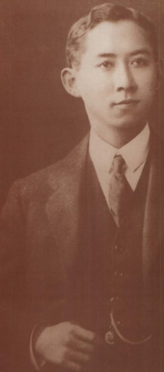
โปรดเกล้าฯ พระราชทาน