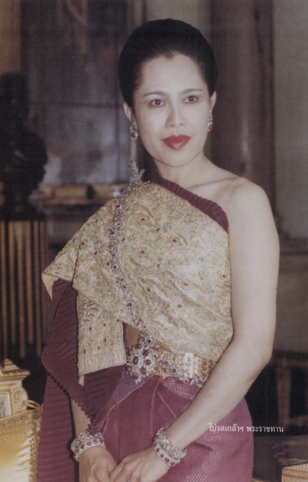
โปรดเกล้าฯ พระราชทาน