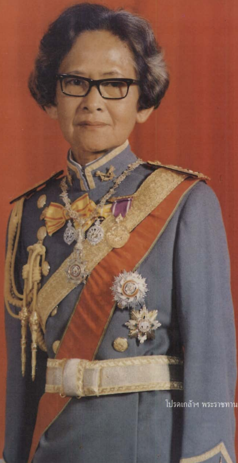
โปรดเกล้าฯ พระราชทาน