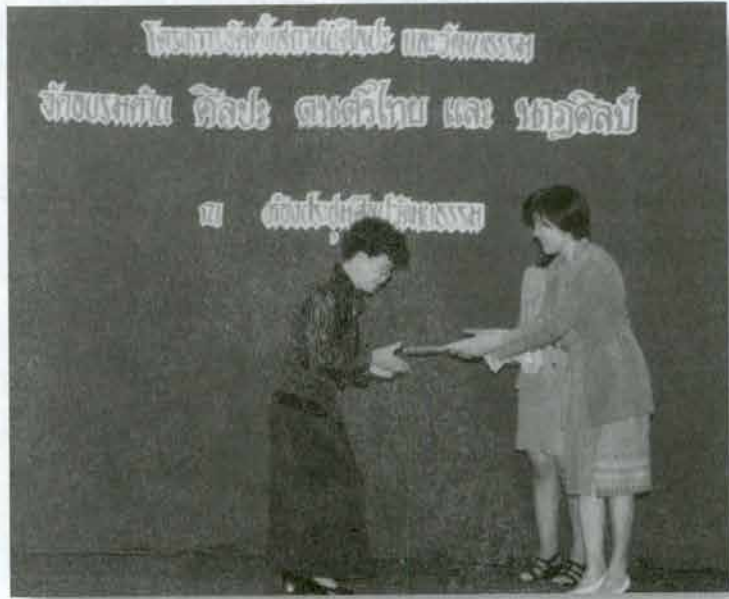
ประธานโครงการจัดตั้งสถาบันศิลปะและวัฒนธรรม มอบวุฒิบัตรให้ผู้เข้ารับการอบรม โครงการอบรมผู้สอนดนตรีไทย