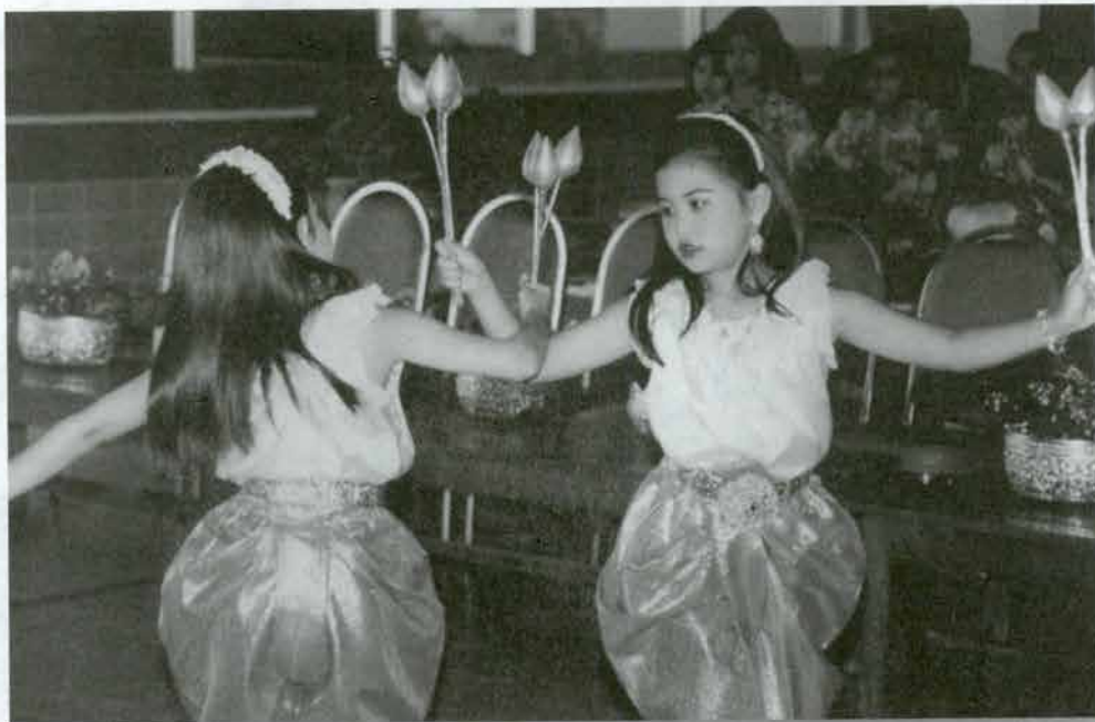
ระบำดอกบัว