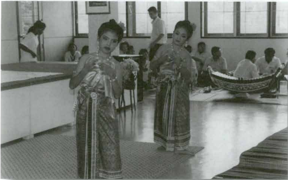
ผู้ฝึกสอนและนักเรียน ครูผู้สอนและนักเรียน วิทยาลัยการอาชีพ วัฒนศิริ