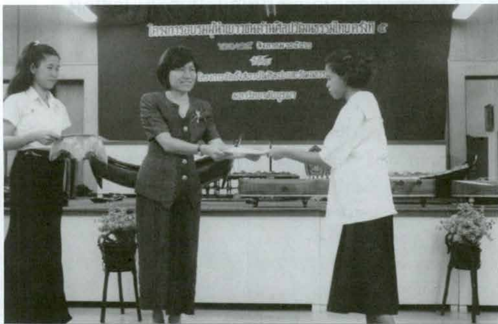
รับวุฒิบัตร