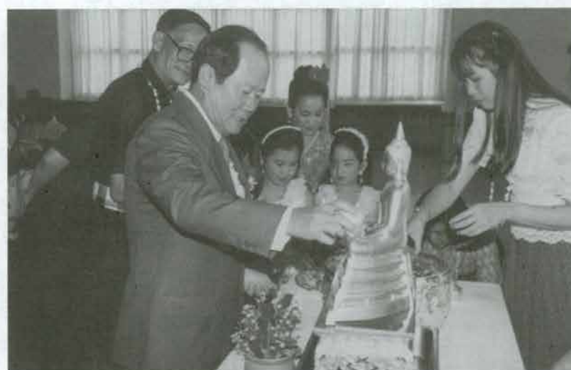
นายกสภา มหาวิทยาลัย สงขลานครินทร์