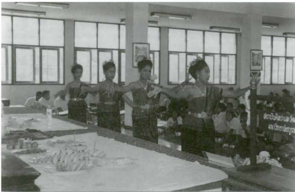
โรงเรียนชุมชนวัดบ้านระกาศ จำถวายมือ