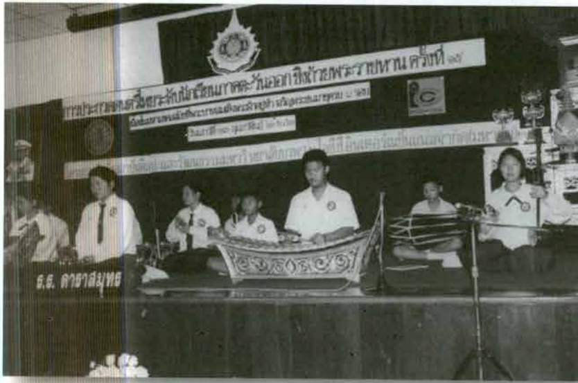
การประกวดดนตรีไทย ประเพณีปี่พาทย์ไม้แฉม ระดับมัธยมศึกษา