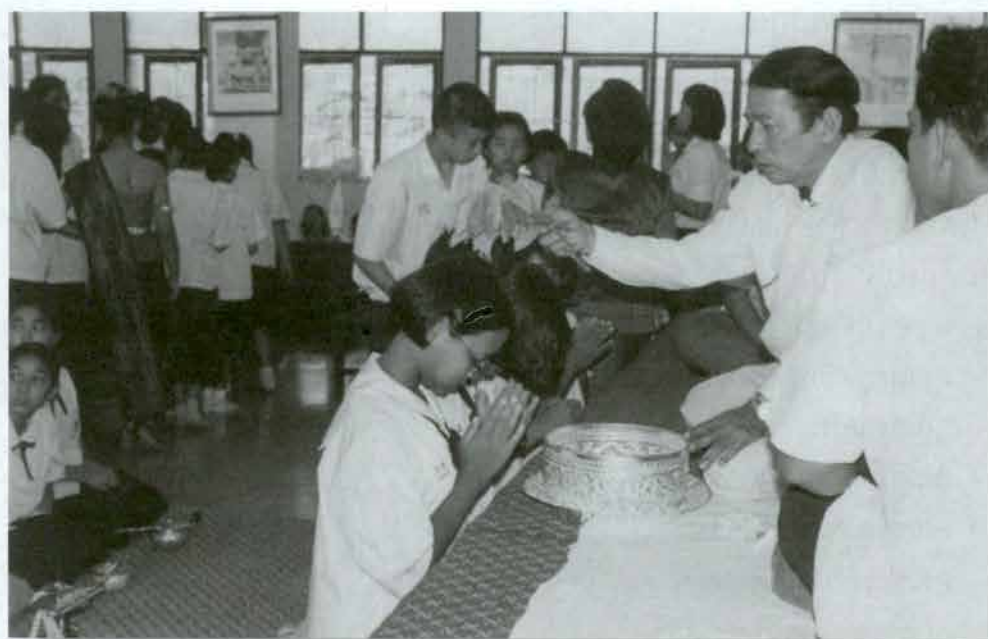
พิธีครอบครู