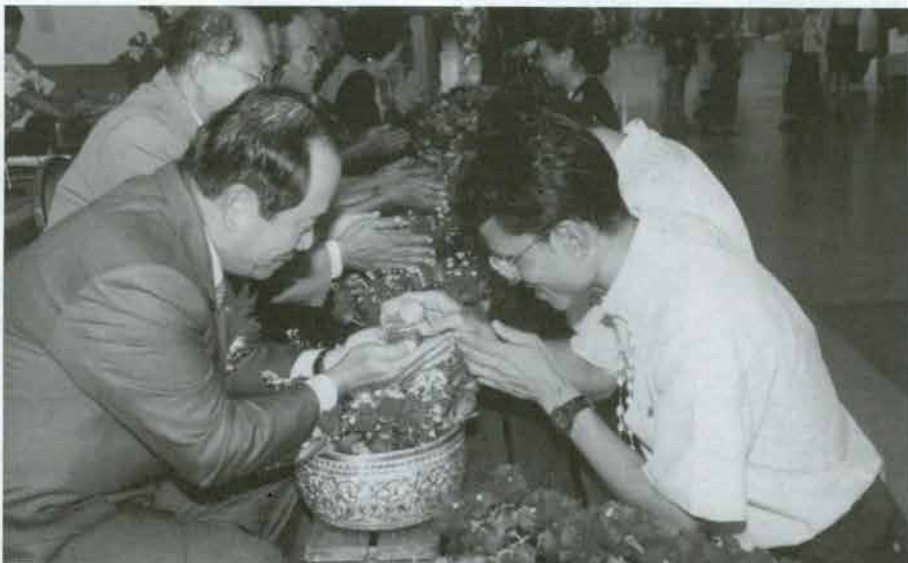
พิธีรดน้ำขอพรนายกสภามหาวิทยาลัย อธิการบดี และอาจารย์อาวุโส