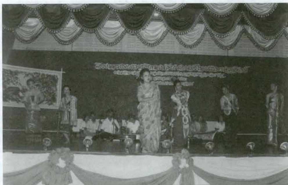
ระบำเผ่าไทย