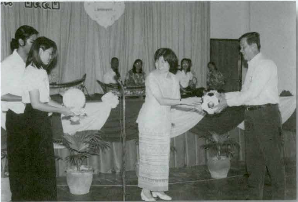
โรงเรียนหล่มเก่าวิทยาคม

มอบอุปกรณ์การศึกษา, เสื้อผ้า, หนังสือ, และเงิน แก่โรงเรียนต่าง ๆ