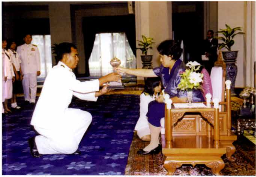
ผู้อำนวยการโรงเรียนราชวินิตบางแก้ว เข้ารับพระราชทานถ้วยรางวัลชนะเลิศ ประกวดวงปี่พาทย์ไม้ยมม ระดับมัธยมศึกษา