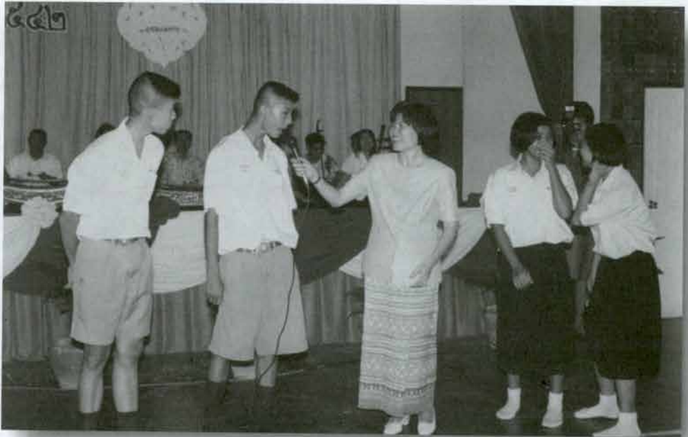
ตอบปัญหาคนตรีไทย