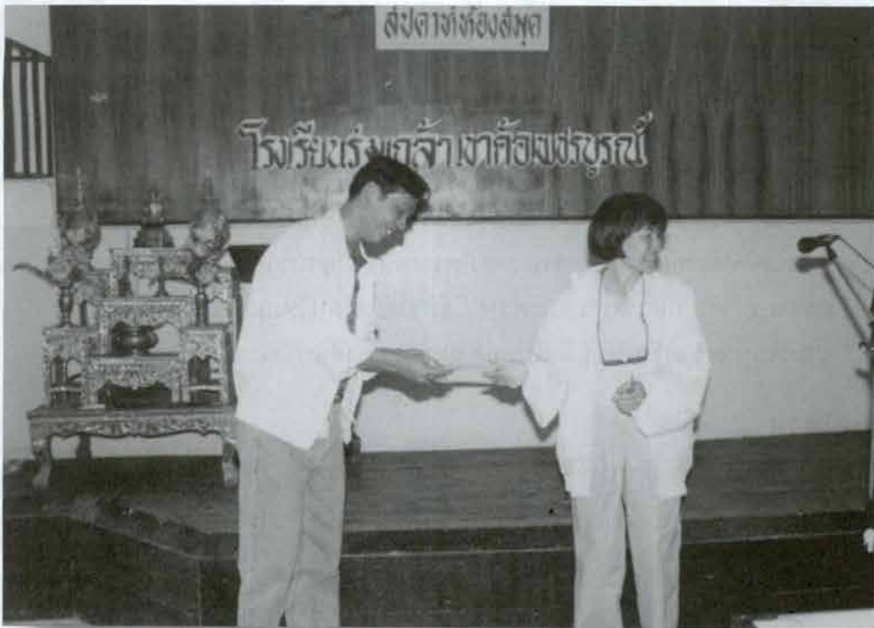
โรงเรียนร่วมเกล้า