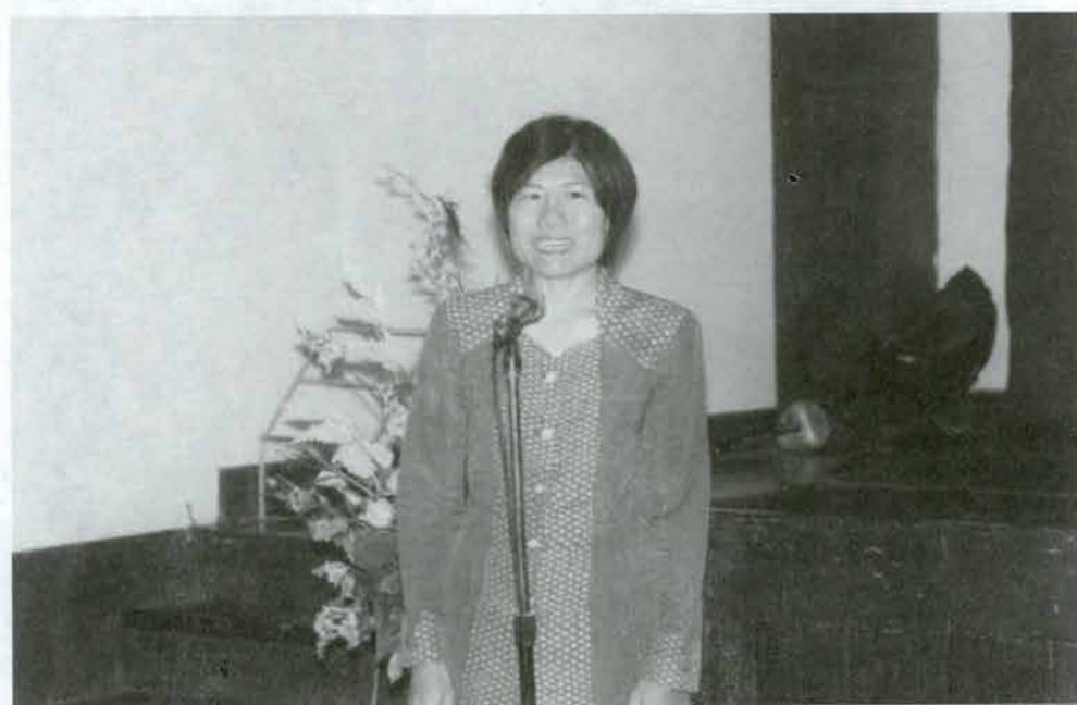
ประธานโครงการจัดตั้งสถาบันศิลปะและวัฒนธรรม กล่าวในพิธีปิดการอบรม