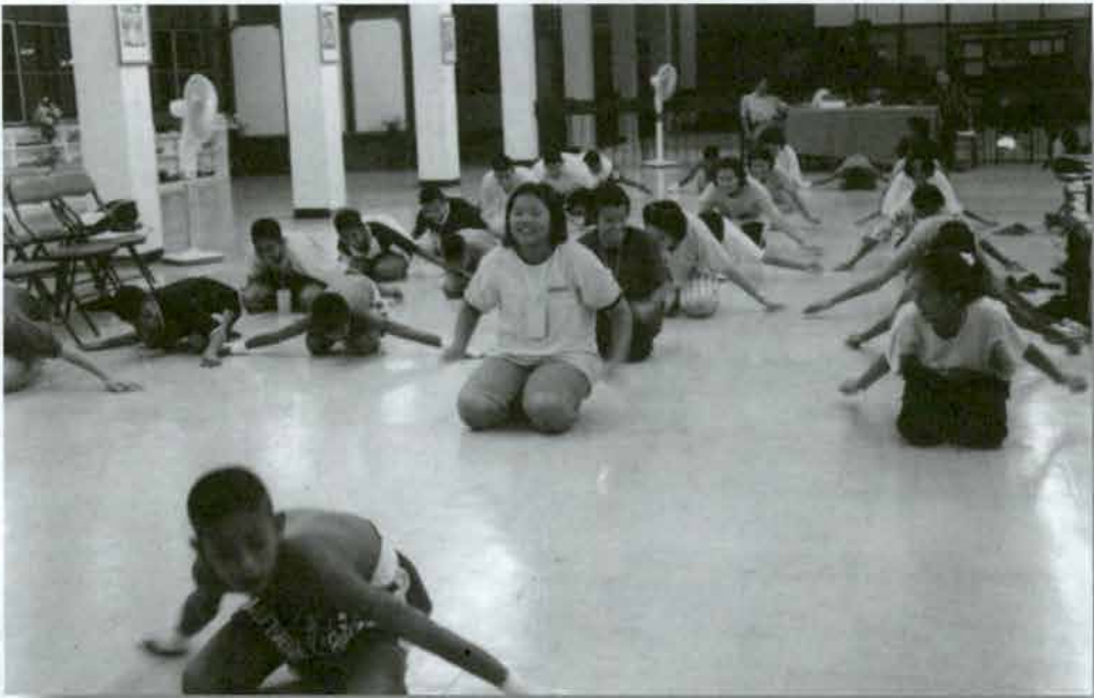
ฝึกไหว้ครู ก่อนฝึกแม่ไม้มวยไทย