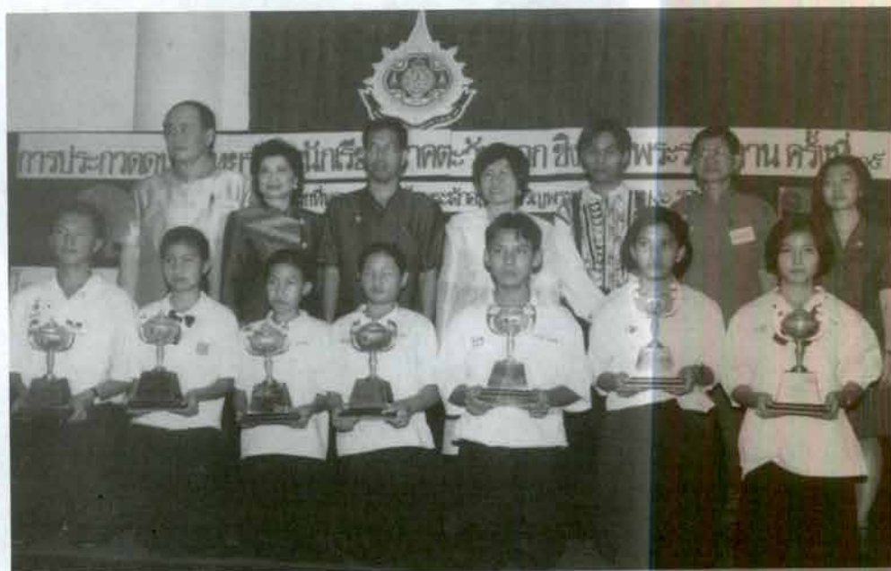
คณะกรรมการดำเนินงานถ่ายภาพร่วมกับผู้ชนะเลิศทั้ง 7 ประเภท