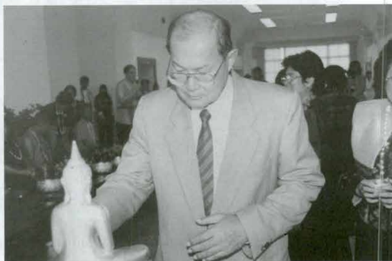
ทำนอติการบดี สงขลานครินทร์