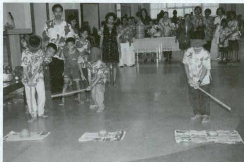
ปิดตาตีหม้อ