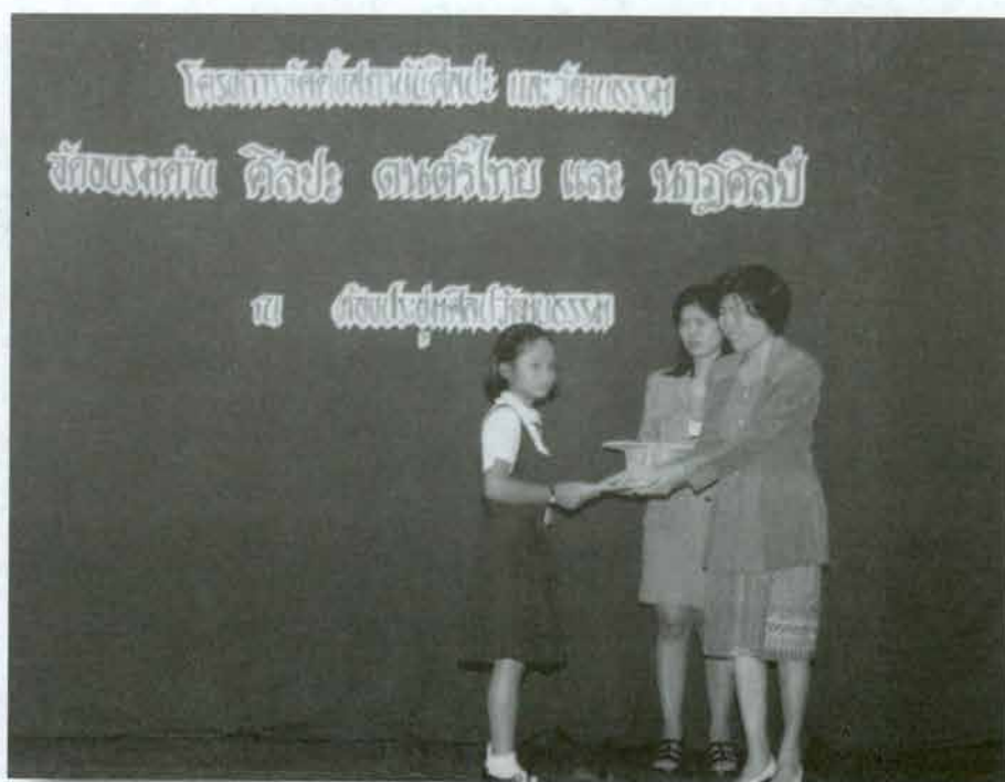
พิธีมอบวุฒิบัตรให้ผู้เข้ารับการอบรมดนตรีไทย