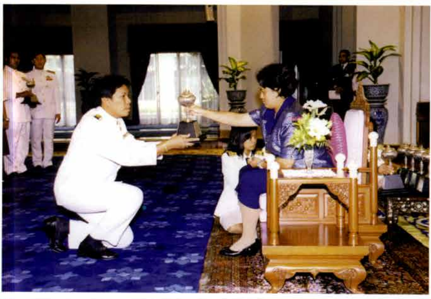
อาจารย์ผู้สอนดนตรีไทยโรงเรียนราชวินิตบางแก้ว เข้ารับพระราชทานถ้วยรางวัลชนะเลิศ ประกวดวงเครื่องสายผสม ระดับมัธยมศึกษา