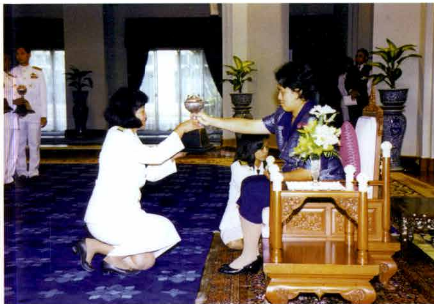
ผู้อำนวยการโรงเรียนวัดบ้านระกาศ สมุทรปราการ เข้ารับพระราชทานถ้วยรางวัลชนะเลิศ ประเภทวงเครื่องสายผสม ระดับประถมศึกษา