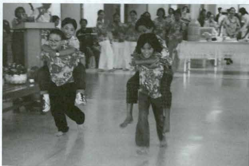
ขี่ม้าส่งเมือง