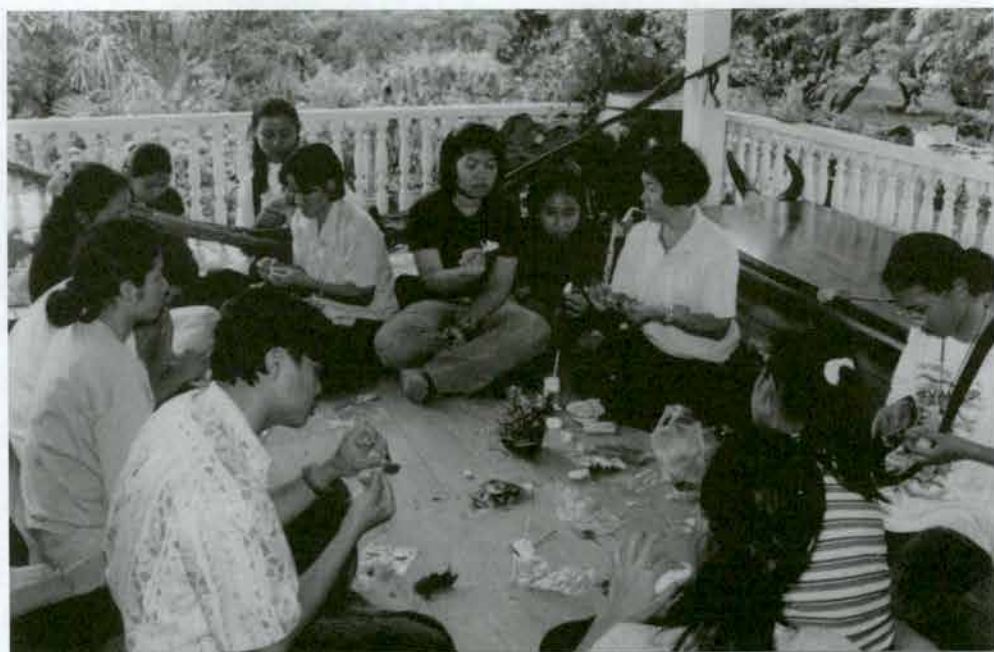
ฝึกงานปั้นแป้งผสมกระดาษสา