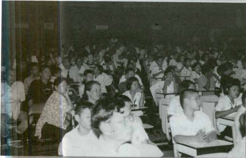
ส่วนหนึ่งของผู้ชม การประกวด