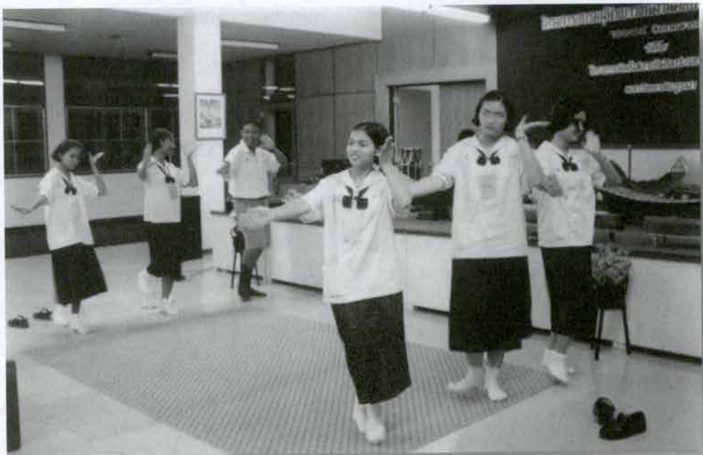
ฝึกนาฏศิลป์ไทย