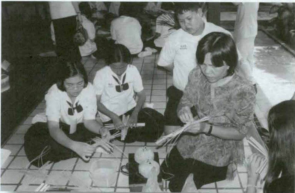
ฝึกสานกระดาษ