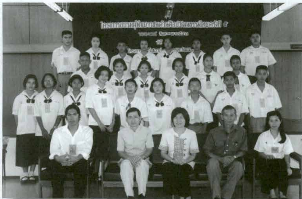
ถ่ายภาพร่วมกันเป็นที่ระลึก