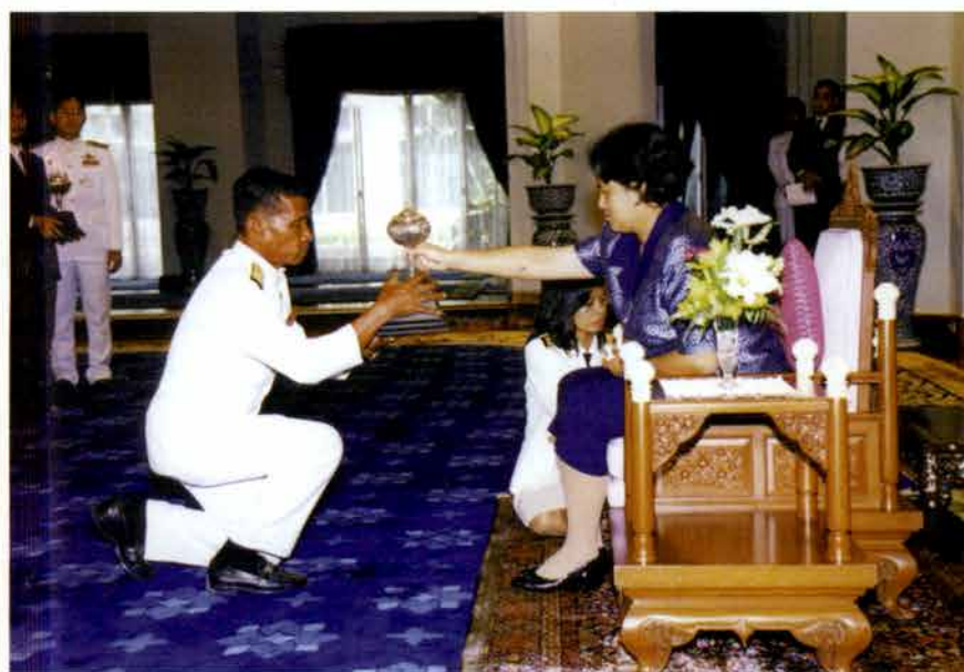
ผู้แทนโรงเรียนวัดบ้านระกาศ สมุทรปราการ เข้ารับพระราชทานถ้วยรางวัล ชนะเลิศประเภทวงอังกะลุง ระดับประถมศึกษา