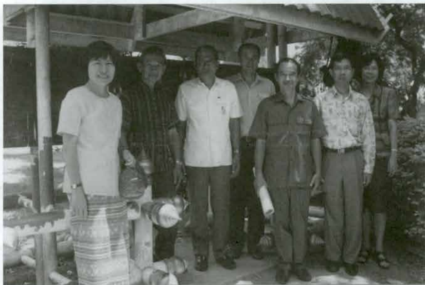
ถ่ายรูปกับผู้บริหารโรงเรียนเพชรพิทยาคม

ณ โรงเรียนเพชรพิทยาคม, โรงเรียนหล่มเก่าวิทยาคม, โรงเรียนอนุบาลหล่มเก่า โรงเรียนเมืองрад จังหวัดเพชรบูรณ์