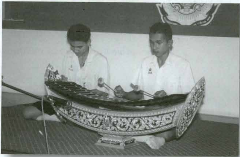
การแข่งขัน ระนาดเอกเดี่ยว ระดับมัธยมศึกษา