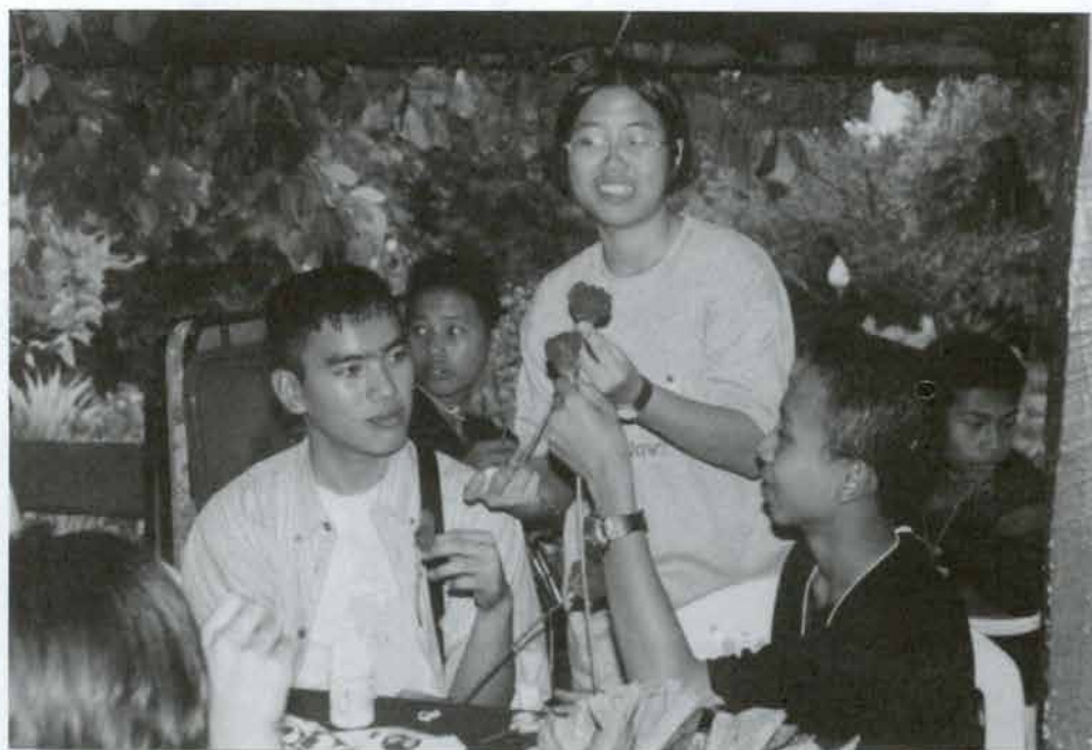
ฝึกทำดอกไม้ประดิษฐ์