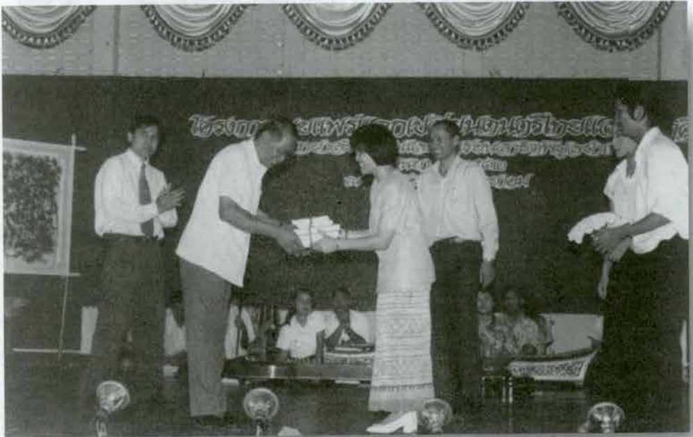
โรงเรียนเพชรพิทยาคม