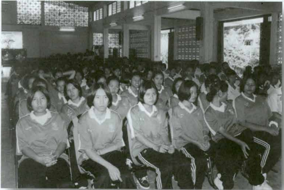
ผู้ชม โรงเรียนเพชรพิทยาคม