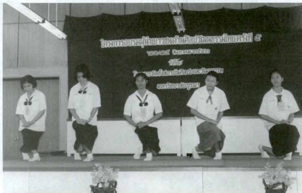
ฝึกมารยาทไทย