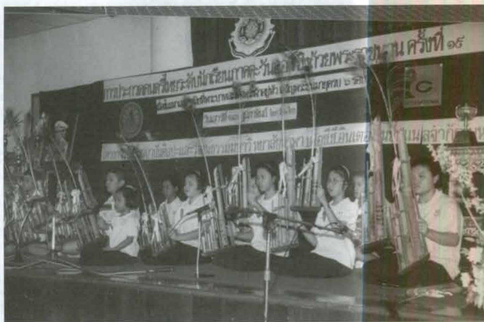
การประกวดดนตรีไทย ประเภทวงมโหรี ระดับประถมศึกษา