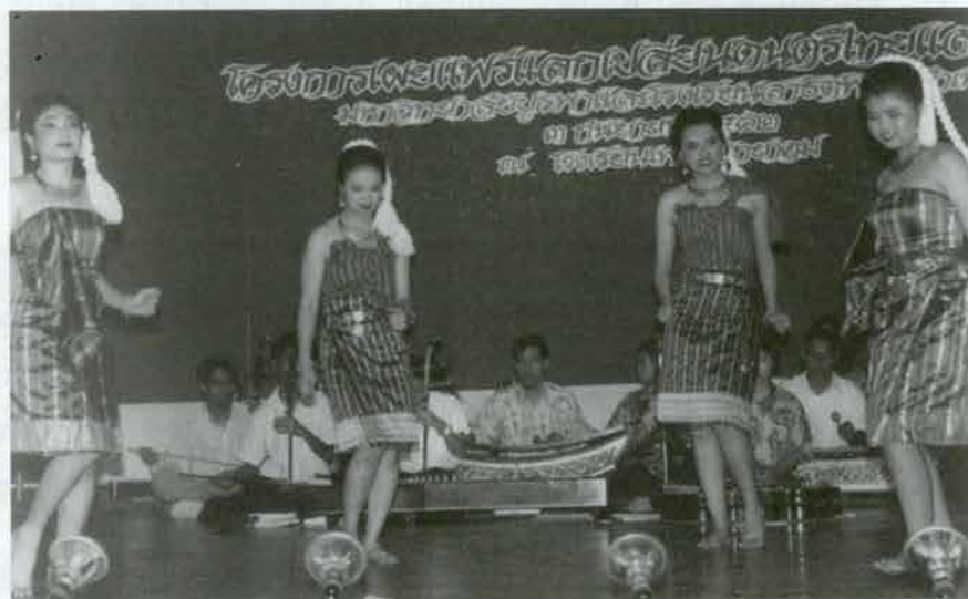
การแสดงที่นำไปเผยแพร่ เชียงโปงกลาง