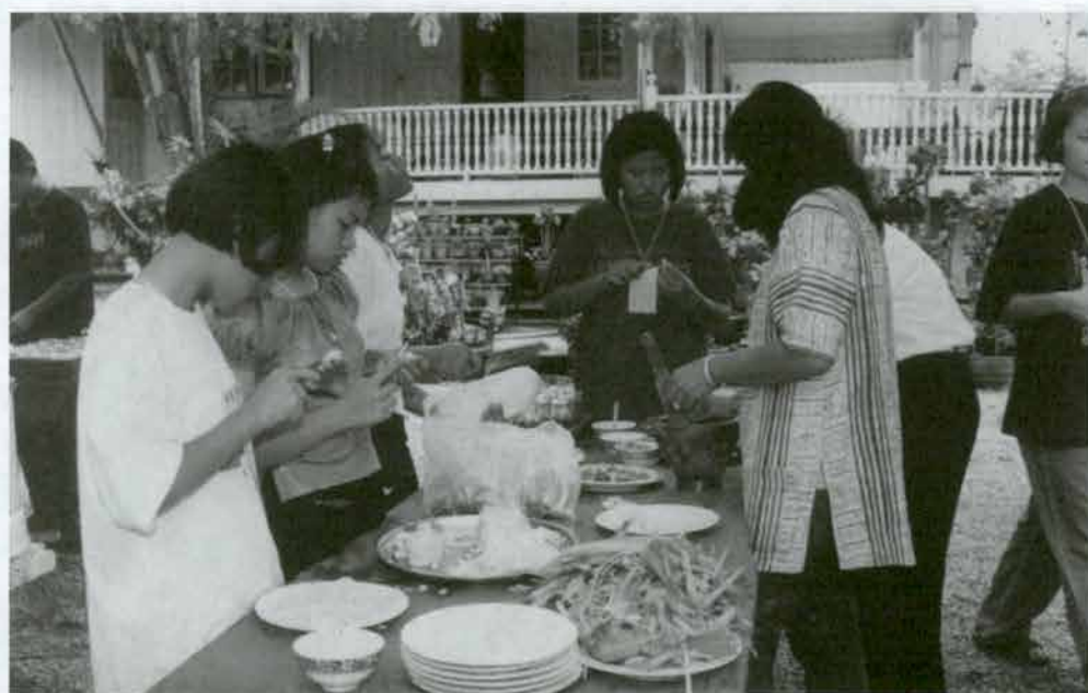
ฝึกแกะสลักผัก