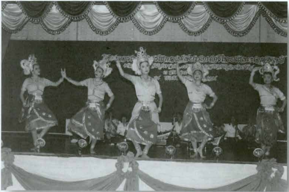
ระบำโบราณคดี ชุตลพบุรี