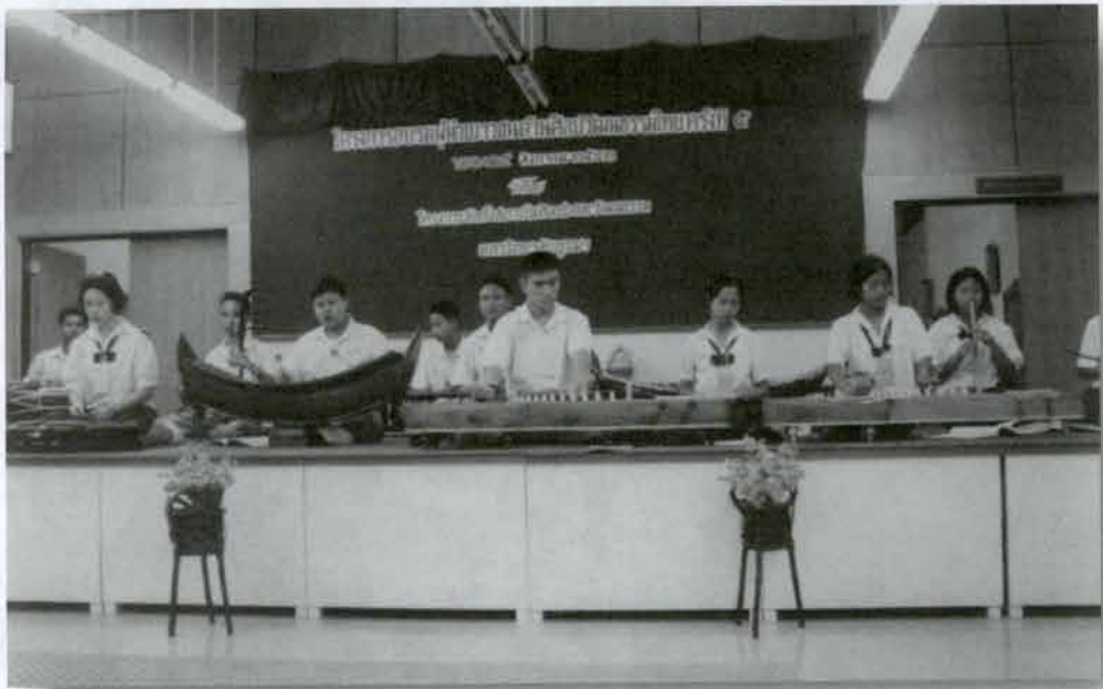
ฝึกดนตรีไทย