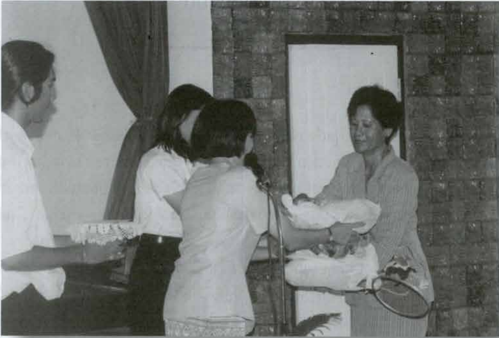
โรงเรียนเมืองรัต

มอบอุปกรณ์การศึกษา, เสื้อผ้า, หนังสือ, และเงิน แก่โรงเรียนต่าง ๆ