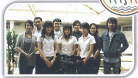
ทีมงานวิจัยไทยคิด และทีมงาน GJR