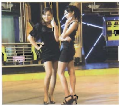
นางแบบ แสดงเครื่องประดับที่ทำจาก Nano - silver clay