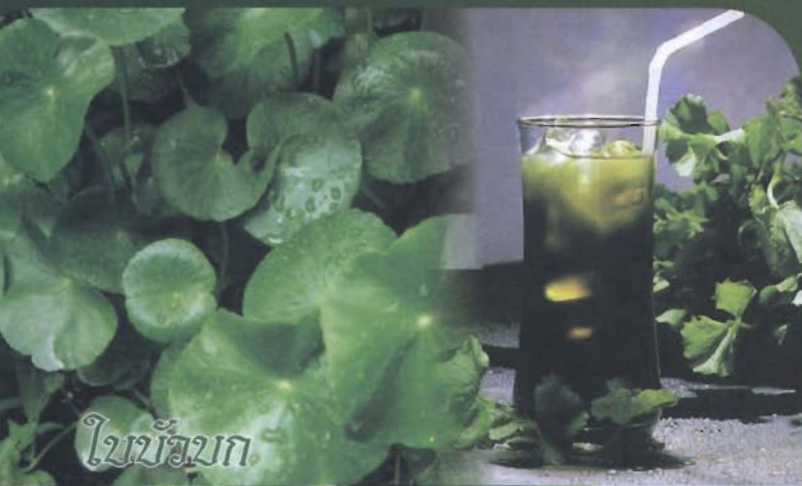
ใบโหระพา

สำหรับวันนี้เรามีประเด็นเรื่องของสมุนไพรมาฝากกัน ซึ่งในปัจจุบันถึงแม้ค่านิยมต่าง ๆ จะเปลี่ยนไป แต่ก็ยังมีการนำสมุนไพรมาทำเป็นเครื่องดื่มมากมาย ซึ่งน้ำสมุนไพรเหล่านี้ล้วนแต่มีประโยชน์ต่อร่างกายเป็นอย่างมาก จึงขอยกเอา 4 สูดยอดน้ำสมุนไพรที่อุดมไปด้วยคุณประโยชน์มาฝากทุกท่าน