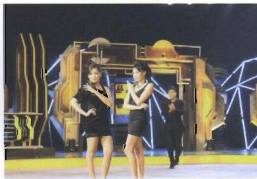
การเดินแบบของนางแบบ แสดงเครื่องประดับที่ทำจาก Nano - silver clay