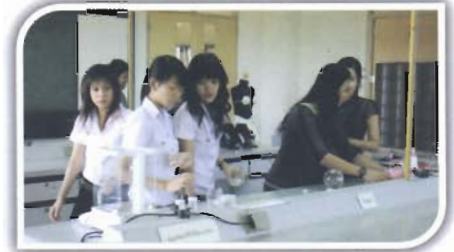
นิสิตเตรียมงานทำเครื่องประดับ