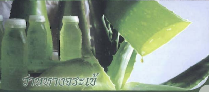
ว่านหางจระเข้

เริ่มกันที่น้ำสมุนไพรที่ทุกท่านรู้จักเป็นอย่างดี น้ำใบโหระพามีวิตามินเอสูงมาก เหมาะสำหรับคนที่ต้องใช้สายตาทำงานหนักอยู่เป็นประจำ เพราะจะช่วยบำรุงสายตาได้อย่างดี และยังมีแคลเซียมและวิตามินบี1 สูงกว่าผักชนิดอื่นอีกด้วย ประโยชน์อื่น ๆ ของน้ำใบโหระพาคือ ใช้แก้ไข้ใน แก้ฟกช้ำดำเขียว แก้ร้อนใน บำรุงสมอง บำรุงหัวใจ ถ้าดื่มทุกวันเป็นเวลา 1 อาทิตย์จะช่วยลดความดันโลหิตได้ แก้แผลอักเสบและรักษาแผลในกระเพาะอาหาร ทำให้เลือดแข็งตัวเร็ว ช่วยขับปัสสาวะ