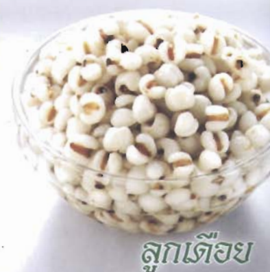
ลูกเดือย