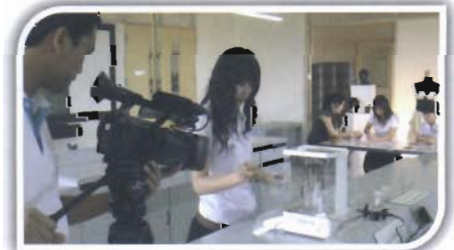
นิสิตสาธิตพร้อมถ่ายทำ