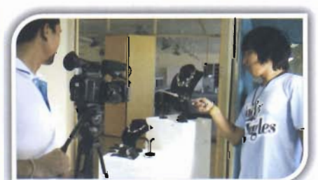
พี่ ๆ ทีมงานถ่ายเครื่องประดับเงิน