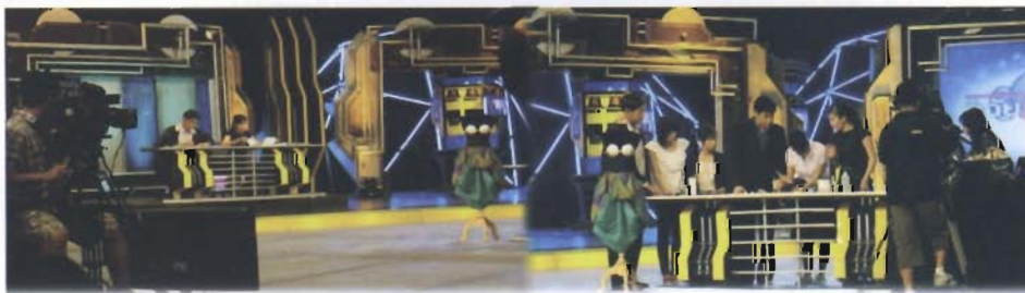
บรรยากาศการถ่ายทำ ที่ Moon Star Studio