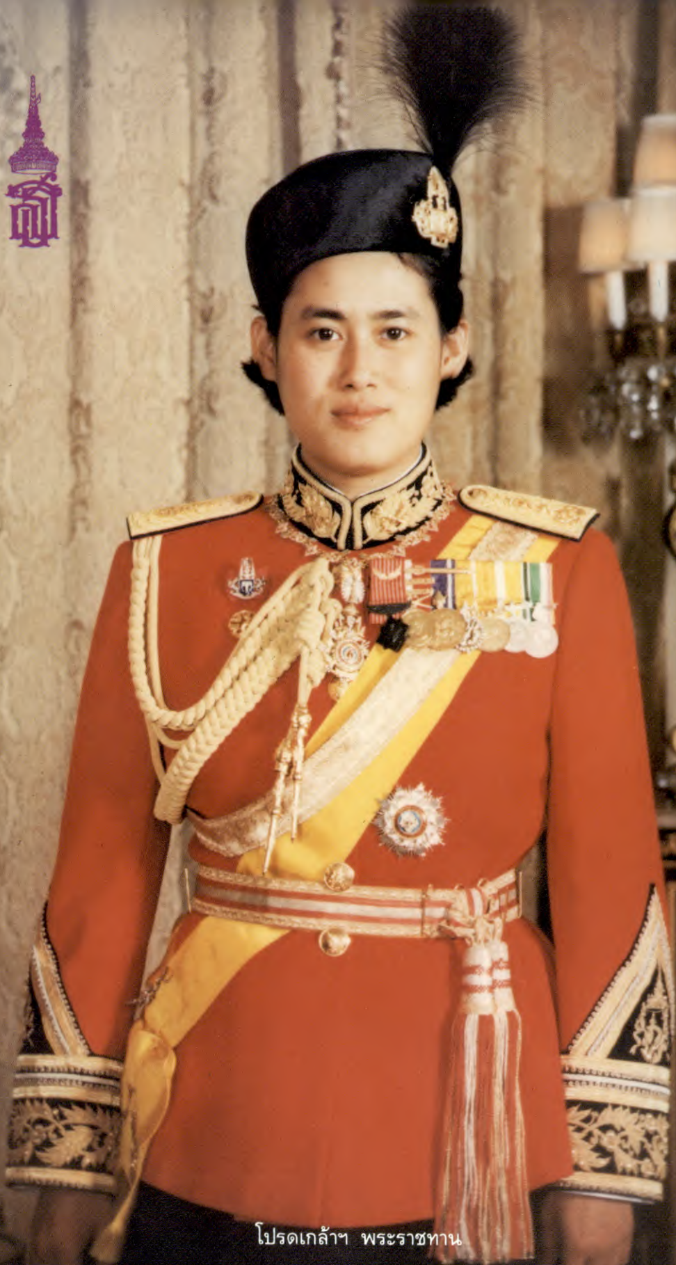
โปรดเกล้าฯ พระราชทาน