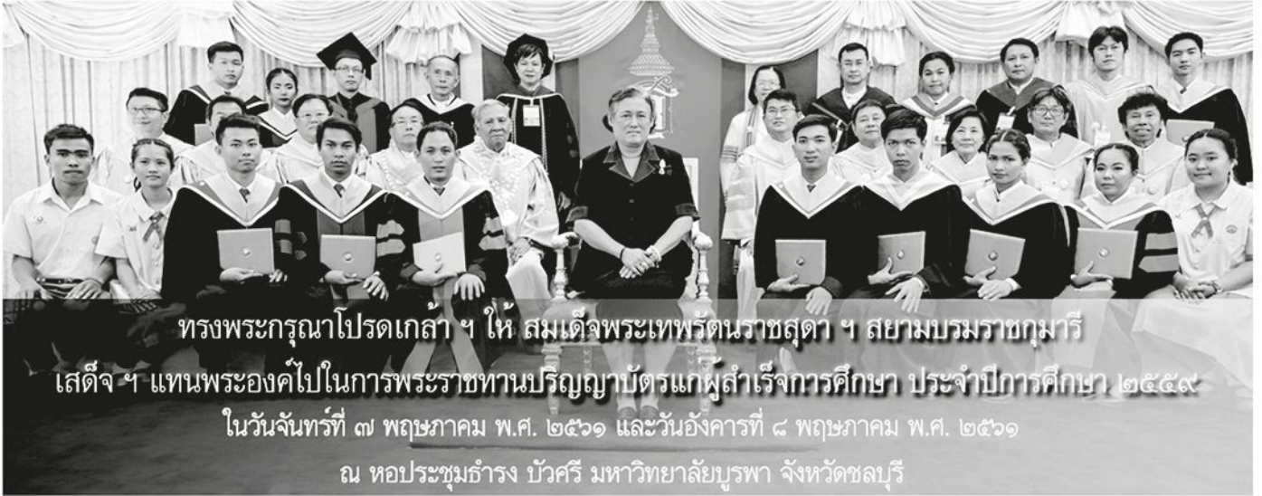
ทรงพระกรุณาโปรดเกล้าฯ ให้ สมเด็จพระเทพรัตนราชสุดาฯ สยามบรมราชกุมารี เสด็จฯ แทนพระองค์ไปในการพระราชทานปริญญาบัตรแก่ผู้สำเร็จการศึกษา ประจำปีการศึกษา ๒๕๕๙ ในวันจันทร์ที่ ๗ พฤษภาคม พ.ศ. ๒๕๖๑ และวันอังคารที่ ๘ พฤษภาคม พ.ศ. ๒๕๖๑ ณ หอประชุมธำรง บัวศรี มหาวิทยาลัยบูรพา จังหวัดชลบุรี