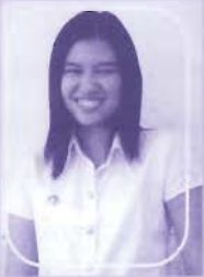
บ.ส.อรอนวดี จารณา สาขาวิชา ประวัติศาสตร์ คณะมนุษยศาสตร์และสังคมศาสตร์