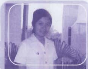
อ.ส.สมหทัย ลาดิวาลัย สาขาวิชาเทคโนโลยีทางการศึกษา คณะศึกษาศาสตร์

ปี พ.ศ. ๒๕๔๗ น้อยาก เห็น เพื่อน ๆ น้อง ๆ นิสิตใน มหาวิทยาลัยบูรพาจัดกิจกรรมใหม่ ๆ ที่เป็น ประโยชน์ต่อนิสิต ต่อ มหาวิทยาลัยและต่อสังคม อยาก เห็นกิจกรรมที่มีทั้ง นิสิต และ มหาวิทยาลัย ร่วมกันคิด ร่วมกันทำ ร่วมกันสร้างสรรค์ออกมาเป็น ของขวัญให้กับศิษย์เก่า ศิษย์ปัจจุบัน ตลอดจน ประชาชนทั่วไป ได้ชื่นชมและได้รู้จักมหาวิทยาลัยบูรพา มากขึ้น เช่น กิจกรรมเกี่ยวกับศิลปวัฒนธรรม กิจกรรมบำเพ็ญ ประโยชน์ กิจกรรมแสดงผลงานของนิสิต แต่ละคณะ เป็นต้น นอกจากนี้ ยังอยากเห็น เพื่อน ๆ น้อง ๆ นิสิตได้มีกิจกรรมร่วมกับ มหาวิทยาลัย อื่นด้วย...สวัสดีปีลิงคะ