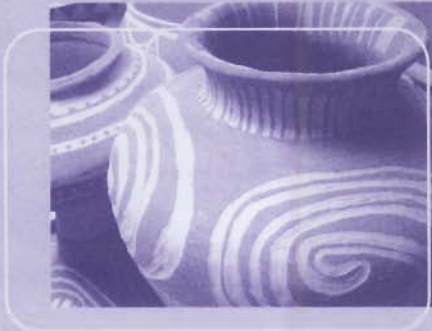
What's up clay