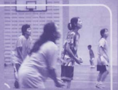
ศึกชิงแชมป์บึงบอปปิงจบลงอย่างอบอุ่น ผลปรากฏว่าสีแดงครองแชมป์กีฬารวม ได้รับชมบึงบอปปิงไปทานกันอย่งหอมหูน้า สำราญ