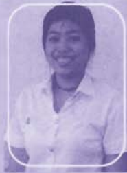
บ.ส.อรอนวดี อ่าววงศ์ สาขาวิชาประวัติศาสตร์และสังคมศาสตร์ คณะมนุษยศาสตร์และสังคมศาสตร์