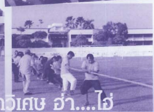
กีฬา กีฬา เป็นยาวิเศษ อ่า...ใช่