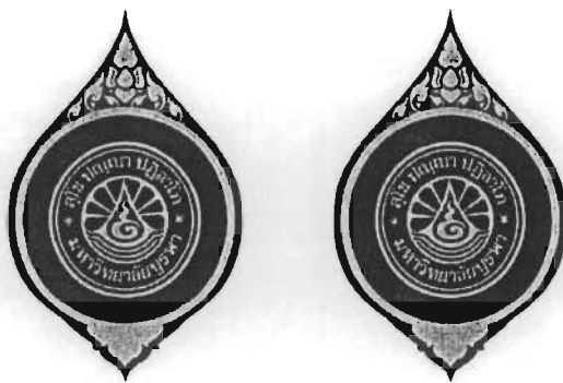
รูปที่ ๒. เข็มตราสัญลักษณ์มหาวิทยาลัย