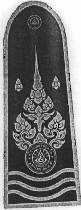
รูปที่ ๔. อินทรธนู