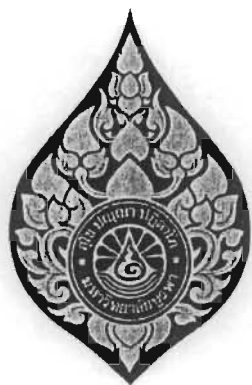
รูปที่ ๓. เครื่องหมายหน้าหมวก