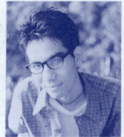
หัตถิกจ วินิจัย 844/103 ถ.สุขุมวิท ต.บางปลาสร้อย อ.เมือง จ.ชลบุรี 20000