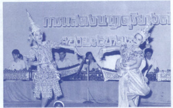
ความสามารถพิเศษที่ได้ใช้ในขณะรับราชการ ที่มหาวิทยาลัยบูรพา