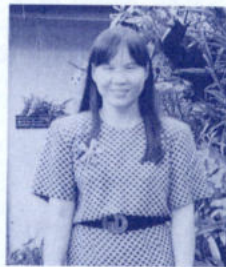
จรัญญา สุภวิทพัฒนา อาคารชุดข้าราชการ มหาวิทยาลัยบูรพา ต.แสนสุข อ.เมือง จ.ชลบุรี 20131

038-745097-100 ห้อง 3407 จันทร์เจ้าแมนชั่น ห้อง 3407 ต.แสนสุข อ.เมือง จ.ชลบุรี 20130