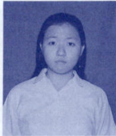
นिसาชล กาญจนพิชิต 35/2 ศูนย์การค้าระยอง ต.ท่าประดู่ อ.เมือง จ.ระยอง 21000