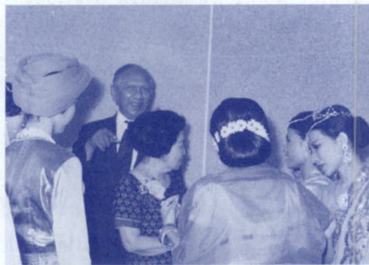
แสดงละครเรื่องมัทนพาธา ปี 2519