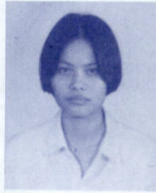
น้ำอ้อย นิลสกุล

80/12 ซ.หลังเทศบาล ต.บางปลาสร้อย อ.เมือง จ.ชลบุรี 20000