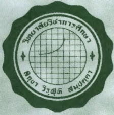
วิทยาลัยศึกษการศึกษ บางแสน พ.ศ. ๒๕๐๐