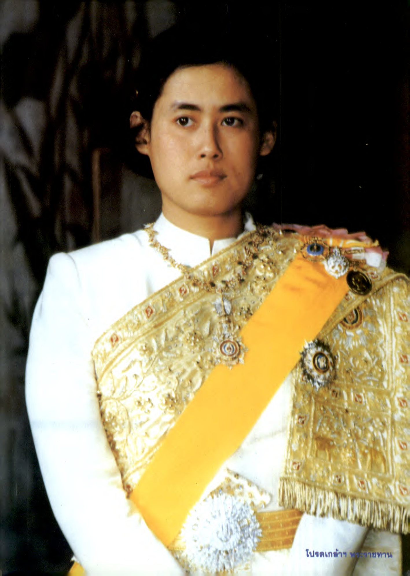
โปรดเกล้าฯ พระราชทาน