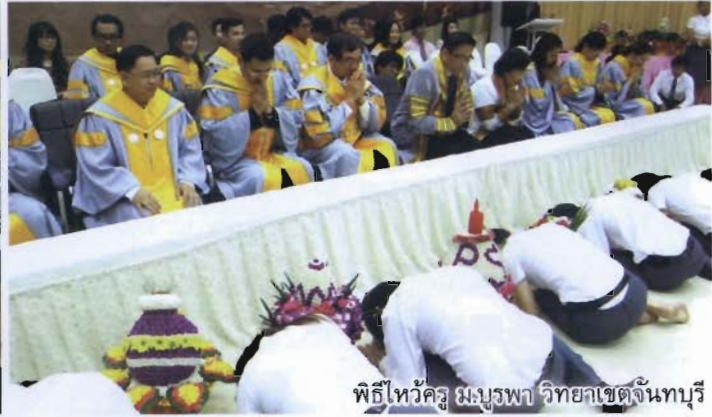
พิธีไหว้ครู มจร.บพ วิทยาเขตจันทบุรี