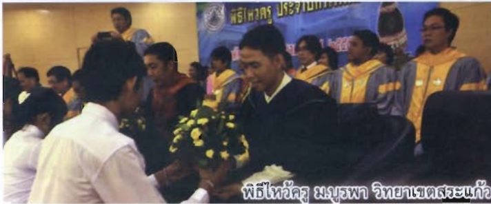
พิธีไหว้ครู มจร.บพ วิทยาเขตสระแก้ว