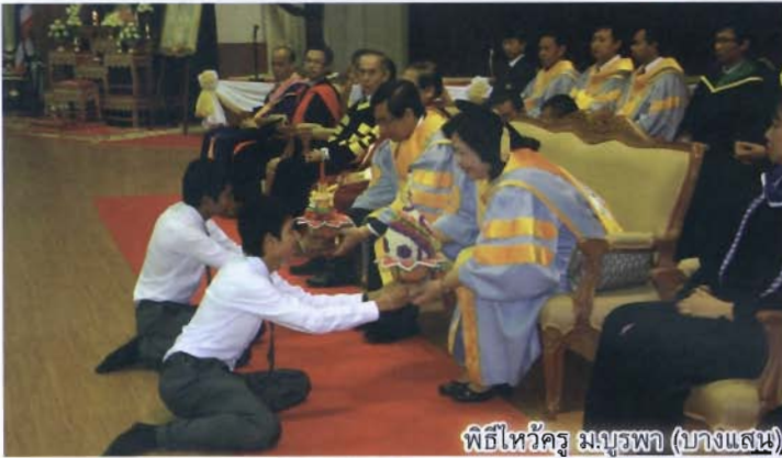
พิธีไหว้ครู มจร.บพ (บางแสน)