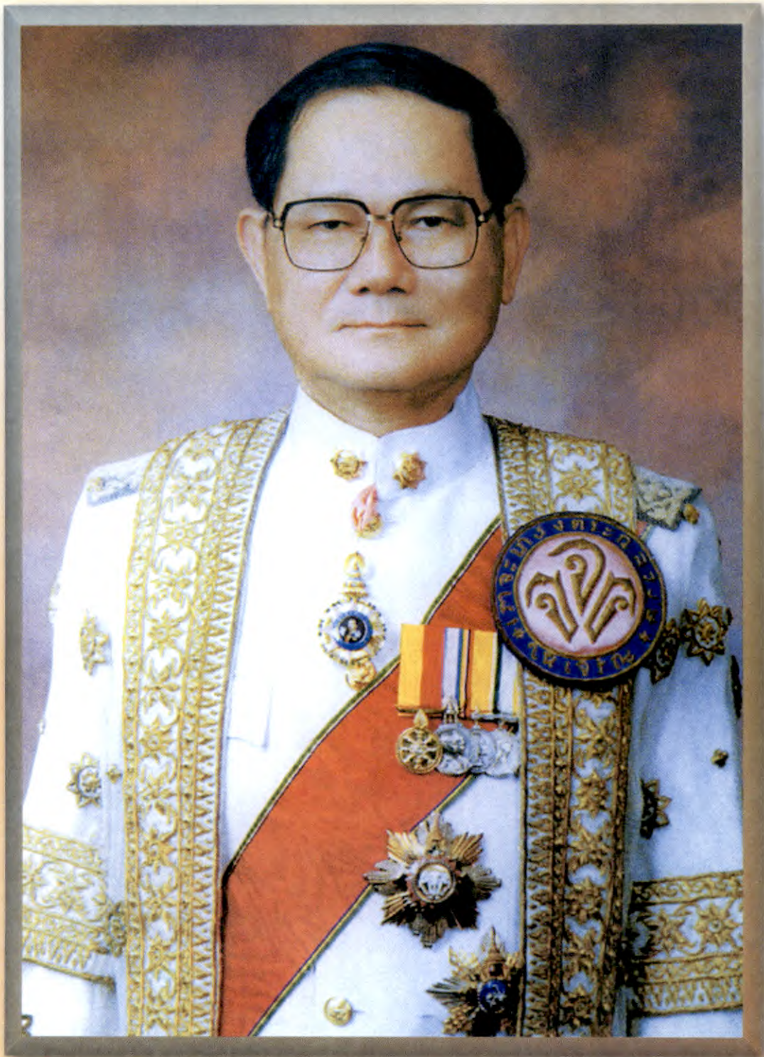
นายมีชัย ฤชุพันธุ์ นายกสภามหาวิทยาลัยบูรพา