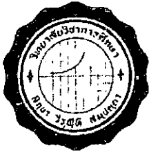
วิทยาลัยศึกษาศึกษา บางแสน พ.ศ. 2498