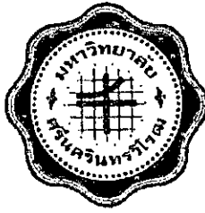
มหาวิทยาลัยศรีนครินทรวิโรฒ วิทยาเขตบางแสน พ.ศ. 2517