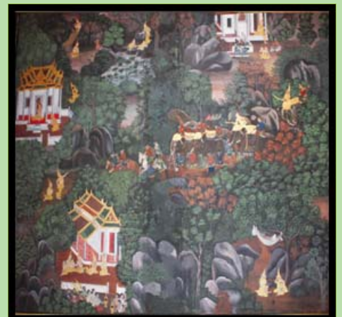
(ภาพจิตรกรรมฝาผนัง ณ อุโบสถวัดพนัญเชิงวรวิหาร จังหวัดพระนครศรีอยุธยา)

มหาวิทยาลัยบูรพา จัดโครงการทำนุบำรุงศิลปวัฒนธรรม “เทศน์มหาชาติ” ในวันพฤหัสบดีที่ ๗ และวันศุกร์ที่ ๘ พฤศจิกายน พ.ศ. ๒๕๕๖ ณ หอประชุมอารัง บัณฑิต มหาวิทยาลัยบูรพา โดยมีวัตถุประสงค์เพื่อให้ผู้บริหาร คณาจารย์ ผู้ปฏิบัติงาน นิสิต นักเรียน และผู้มีจิตศรัทธา ร่วมสร้างงานบุญพิธีมหากุศล เพื่อสืบสานทำนุบำรุงพระพุทธศาสนา อนุรักษ์และส่งเสริมประเพณีอันดีงามของไทย