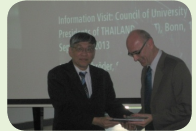
มอบของที่ระลึกกับผู้บริหารที่ประชุมอธิการบดี มหาวิทยาลัยของสหพันธ์สาธารณรัฐเยอรมนี