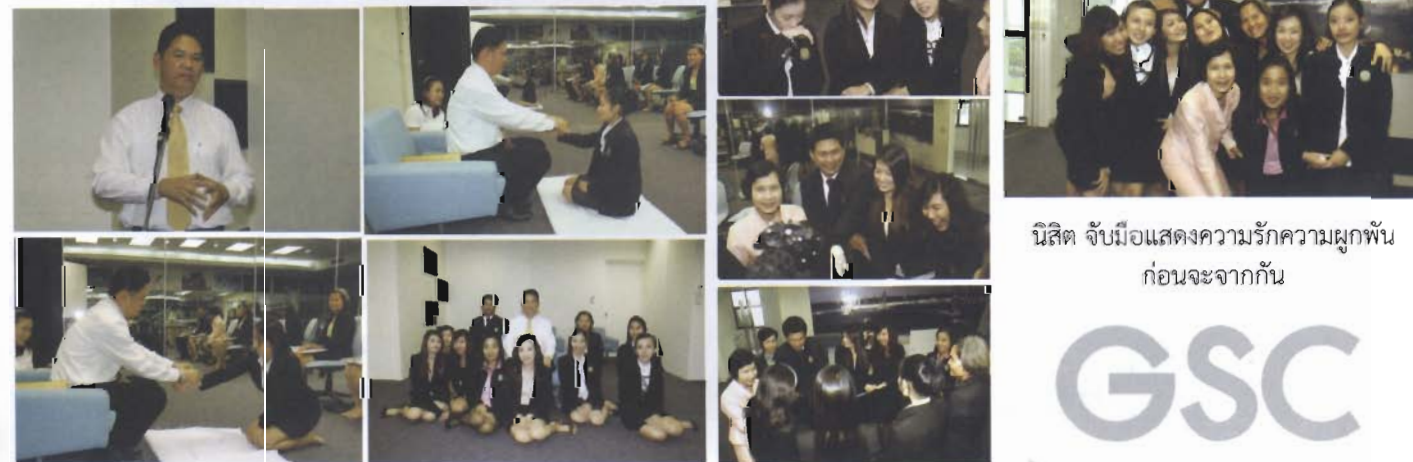
นิสิต จับมือแสดงความรักความผูกพัน ก่อนจะจากกัน