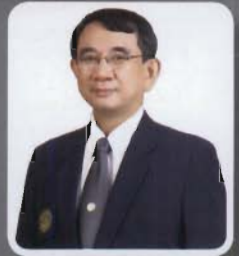
ศ.นพ.สมพล พงศ์ไทย อธิการบดี ม.บูรพา

ประเด็นแรกทางคณะพยาบาลศาสตร์ ก็จะจัดทีมเข้ามาช่วยในเรื่องสุขภาพจิตก่อนเพราะเราเชื่อว่าเขาเครียด บางคนก็อาจจะซึมเศร้าเราต้องพยายามวินิจฉัยให้ได้ก่อนแล้วก็จัดทีมลงไปช่วยดูแลสภาพจิตใจเขา