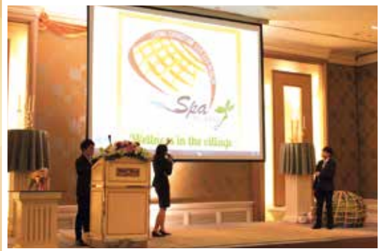
นิสิตกำลังอธิบายภาพแบรนด์โลโก้ “Chong Changtune Live Eco-Museum: Spa de Chong” และ Marketing Tagline: Wellness in the Village