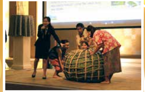
นิสิตกำลังสาธิตการทำสปาสมุนไพร ซึ่งเป็นสิ่งที่จักพัฒนาให้เป็น “ของดี ของเด่น ของดัง” ในชุมชนแห่งนี้ทางการท่องเที่ยวเชิงสุขภาพอย่างสร้างสรรค์