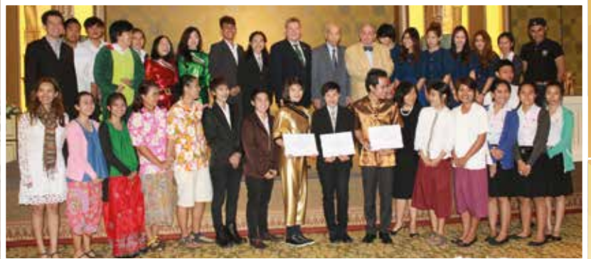
นิสิตถ่ายภาพร่วมกับนิสิตนักศึกษาจากมหาวิทยาลัยที่เข้าร่วมแข่งขันทั้งหมดและคณะกรรมการการตัดสิน