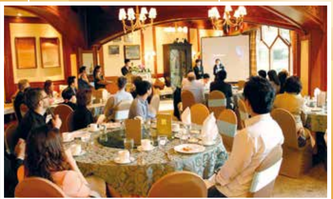
ทีมคณาจารย์ในสาขาฯ และนิสิต พร้อมกับคณะกรรมการจากสมาคมส่งเสริมการท่องเที่ยวภูมิภาคเอเชียแปซิฟิกและผู้เชี่ยวชาญทางการตลาดการท่องเที่ยว