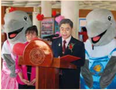
สถาบันวิทยาศาสตร์ทางทะเล มหาวิทยาลัยบูรพา จัดโครงการ "เปิดใจรักการเรียนรู้ปีที่ ๔" เมื่อวันพฤหัสบดีที่ ๑๓ กุมภาพันธ์