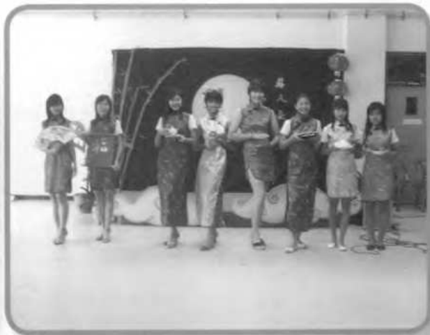
กิจกรรมการแสดง