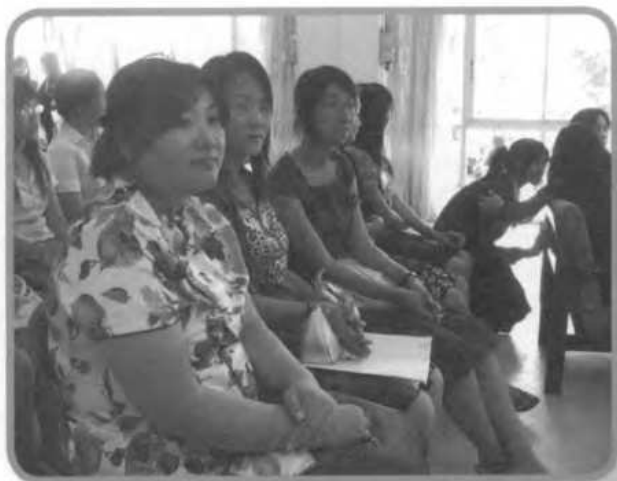
อาจารย์ในสาขาวิชาภาษาจีน