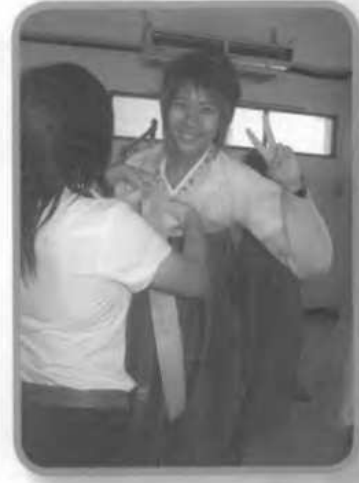
มุมแต่งชุดฮันบก ที่ใคร ๆ ก็อยากลองสวมใส่