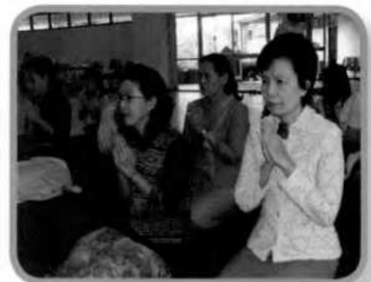
บรรยายกาศการทำบุญตักบาตรช่วงเช้า