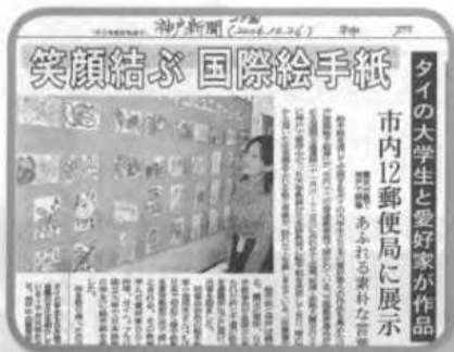
ลงหนังสือพิมพ์โกเบ