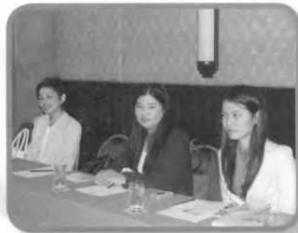
คณาจารย์ภาควิชา