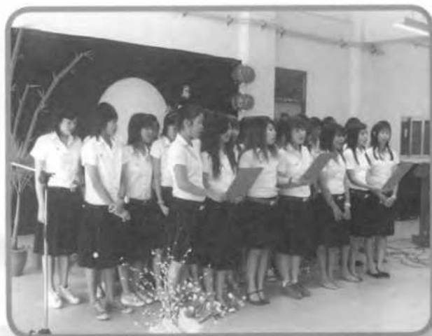
นักร้องเพลงไหว้พระจันทร์