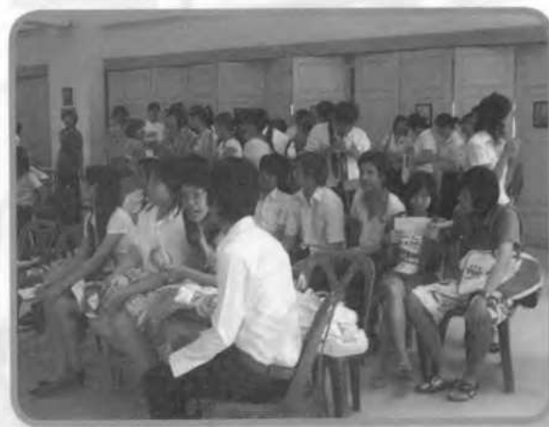
ผู้เข้าร่วมชมโครงการ