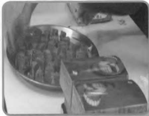
ขนมไหว้พระจันทร์