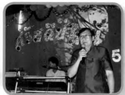
ช่วงค่ำมีการแสดงระหว่างบุคลากรภายในคณะ