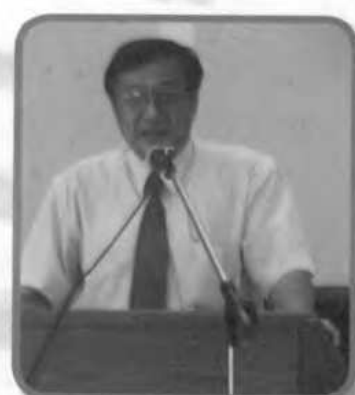
ท่านคณบดีกล่าวเปิดงาน