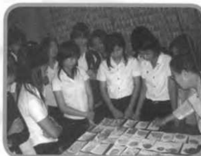
สอนการเขียนจดหมายภาพ