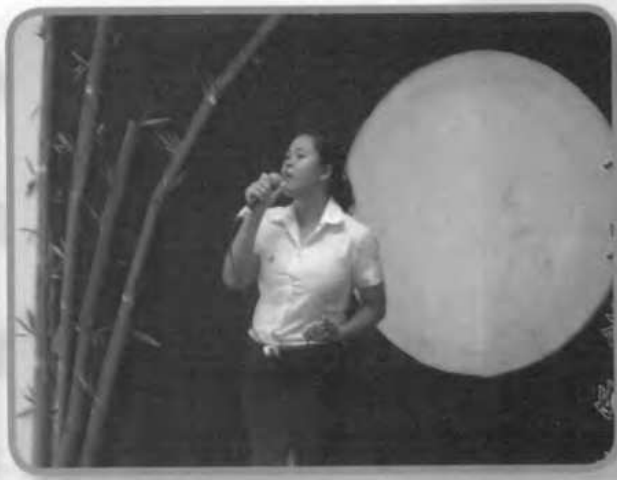
การประกวดร้องเพลง