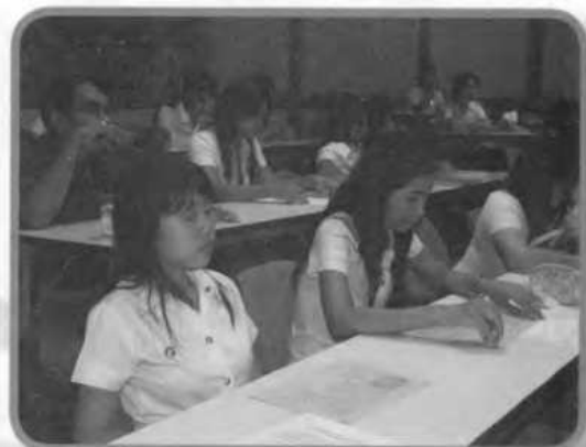
บรรยากาศผู้เข้าร่วมในงานสัมมนา