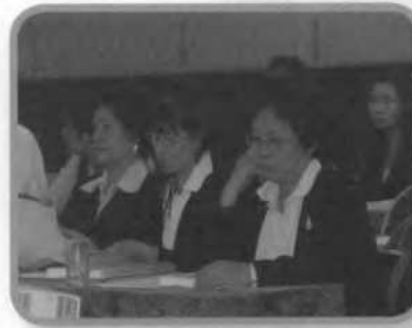
บรรยายการอบรม

เมื่อวันที่ 22-23 มีนาคม 2550 ภาควิชาบริหารธุรกิจ จัดโครงการอบรมเชิงปฏิบัติการเพื่อพัฒนาตำแหน่งวิชาการสำหรับคณาจารย์สายบริหารธุรกิจ ณ โรงแรม เดอะ ไทด์ รีสอร์ท บางแสน จังหวัดชลบุรี