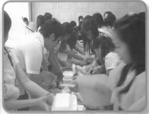
นิสิตให้ความสนใจทำคิมบับอย่างล้นหลาม