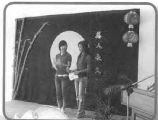
บรรยากาศพิธีเปิด