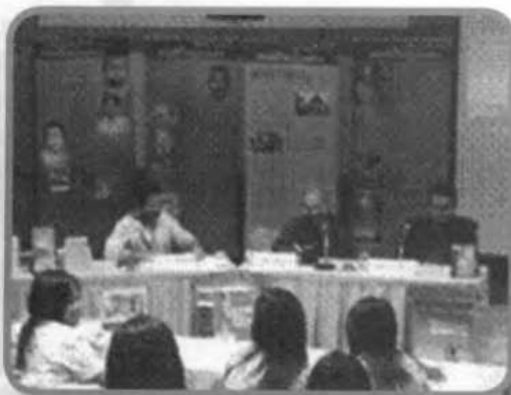
ภาพบรรยากาศการเสวนาทางวิชาการ

ผลที่เกิดจากความสำเร็จของโครงการ ประชากรชาว ม. บูรพาได้ทราบประวัติความเป็นมาและแนวคิดของท่านพุทธทาส ได้อ่านและเป็นเจ้าของหนังสือที่มีหลักธรรมคำสอน รวมทั้งร่วมเสวนาธรรมกับวิทยากร