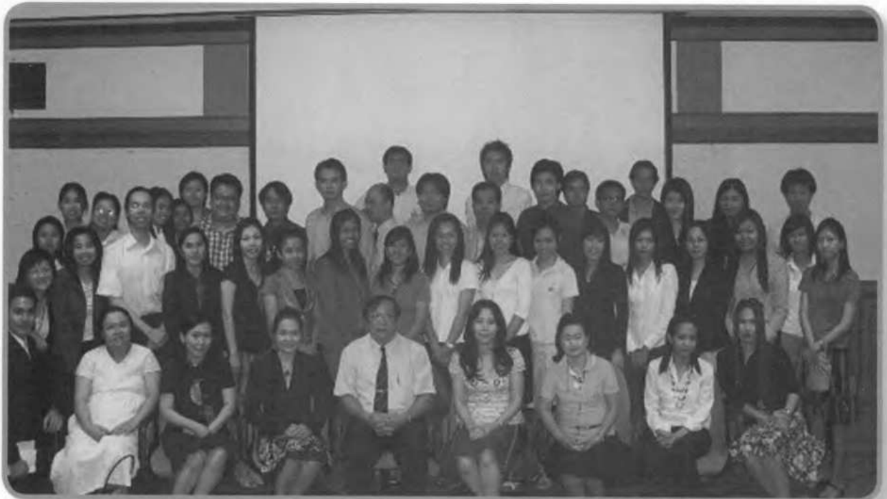
บุคลากร และผู้บริหาร