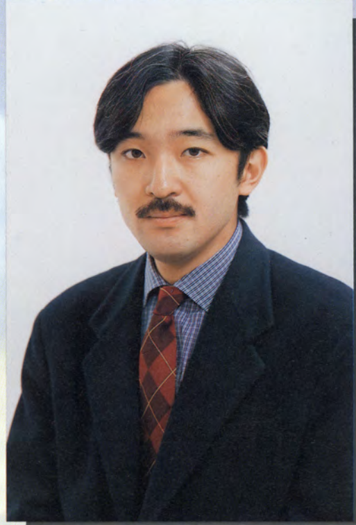
เจ้าชายอากิชิโน His Imperial Highness Prince Akishino