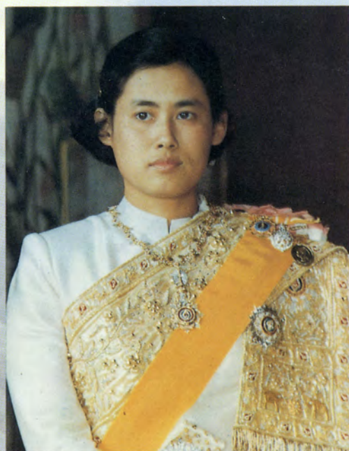
สมเด็จพระเทพรัตนราชสุดาฯ สยามบรมราชกุมารี Her Royal Highness Princess Maha Chakri Sirindhorn