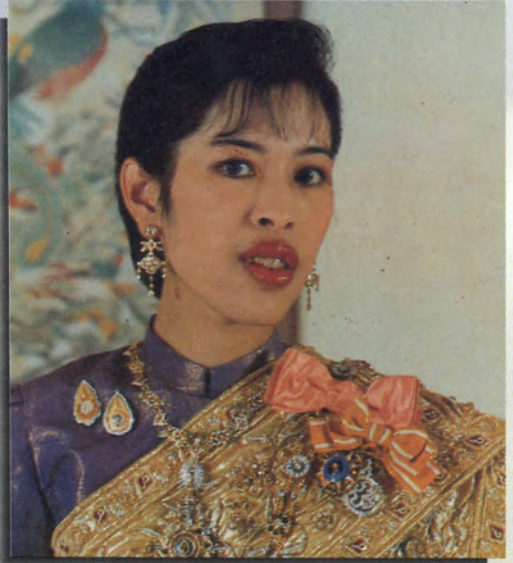
สมเด็จพระเจ้าลูกเธอ เจ้าฟ้าจุฬาภรณวลัยลักษณ์ อัครราชกุมารี Her Royal Highness Princess Chulabhorn