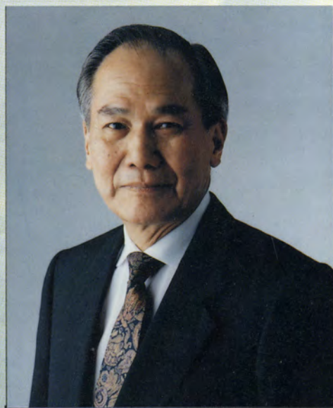
นายอานันท์ ปันยารชุน Mr. Anand Panyarachun

His Royal Highness Crown Prince Maha Vajiralongkorn