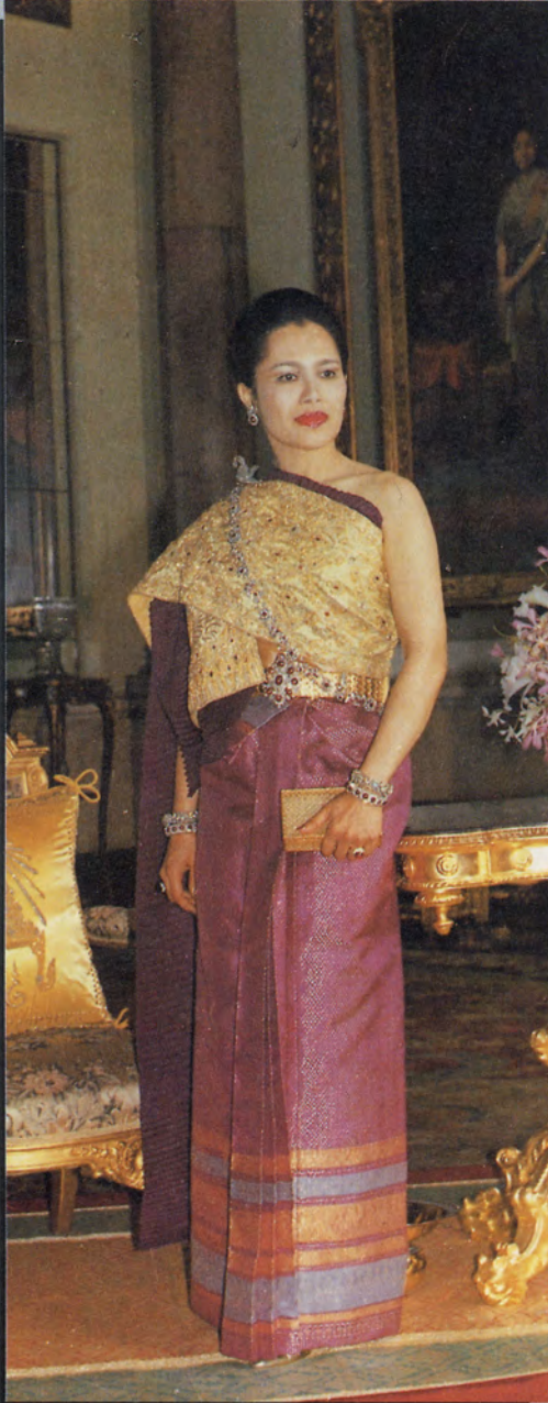
สมเด็จพระนางเจ้าสิริกิติ์ พระบรมราชินีนาถ Her Majesty Queen Sirikit