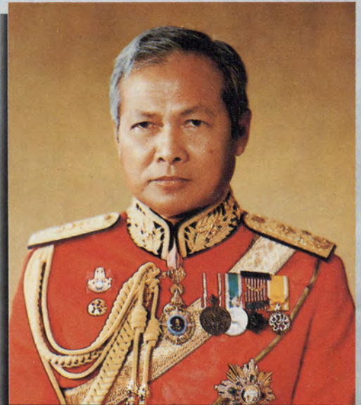
ฯพณฯ พลเอก เปรม ติณสูลานนท์ General Prem Tinsulanonda