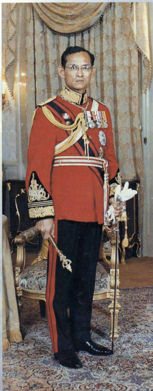
พระบาทสมเด็จพระปรมินทรมหาภูมิพลอดุลยเดชฯ His Majesty King Bhumibol Adulyadej