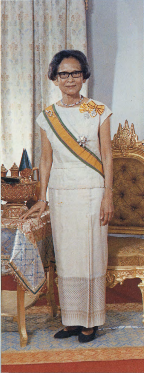
สมเด็จพระศรีนครินทราบรมราชชนนี Her Royal Highness The Princess Mother