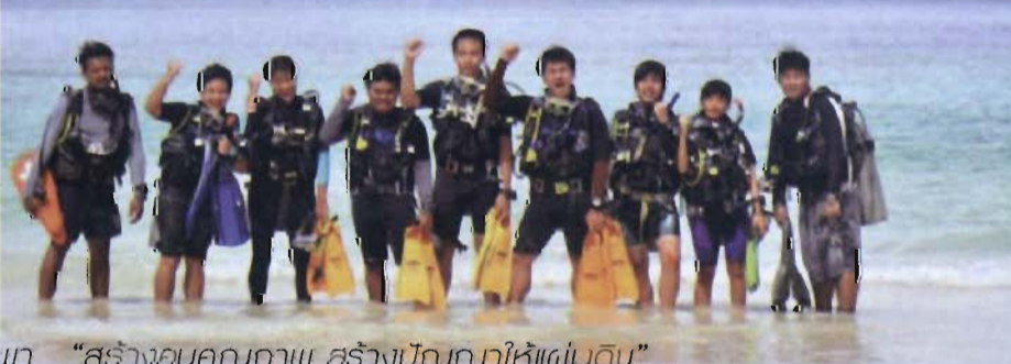
มหาวิทยาลัยบูรพา “สร้างคนคุณภาพ สร้างปัญญาให้แผ่นดิน”