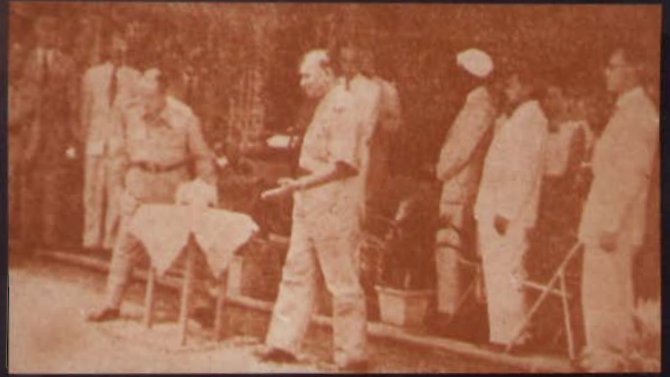
ฯพณฯ พลเอกมังกร พรหมโยธี ทำพิธีเปิดป้ายวิทยาลัยวิชาการ ศึกษา บางแสน

ในโอกาสเดียวกันนี้หม่อมหลวงปิ่น มาลากุล ปลัดกระทรวงศึกษาธิการ ก็ได้มอบคำกลอนที่เขียน ด้วยลายมือของท่านเอง กล่าวถึงการก่อตั้งวิทยาลัยวิชา การศึกษา บางแสน ข้อความดังกล่าว ต่อมาได้ใช้เป็น คำร้องเพลงประจำสถาบันเพลงหนึ่ง ดังนี้