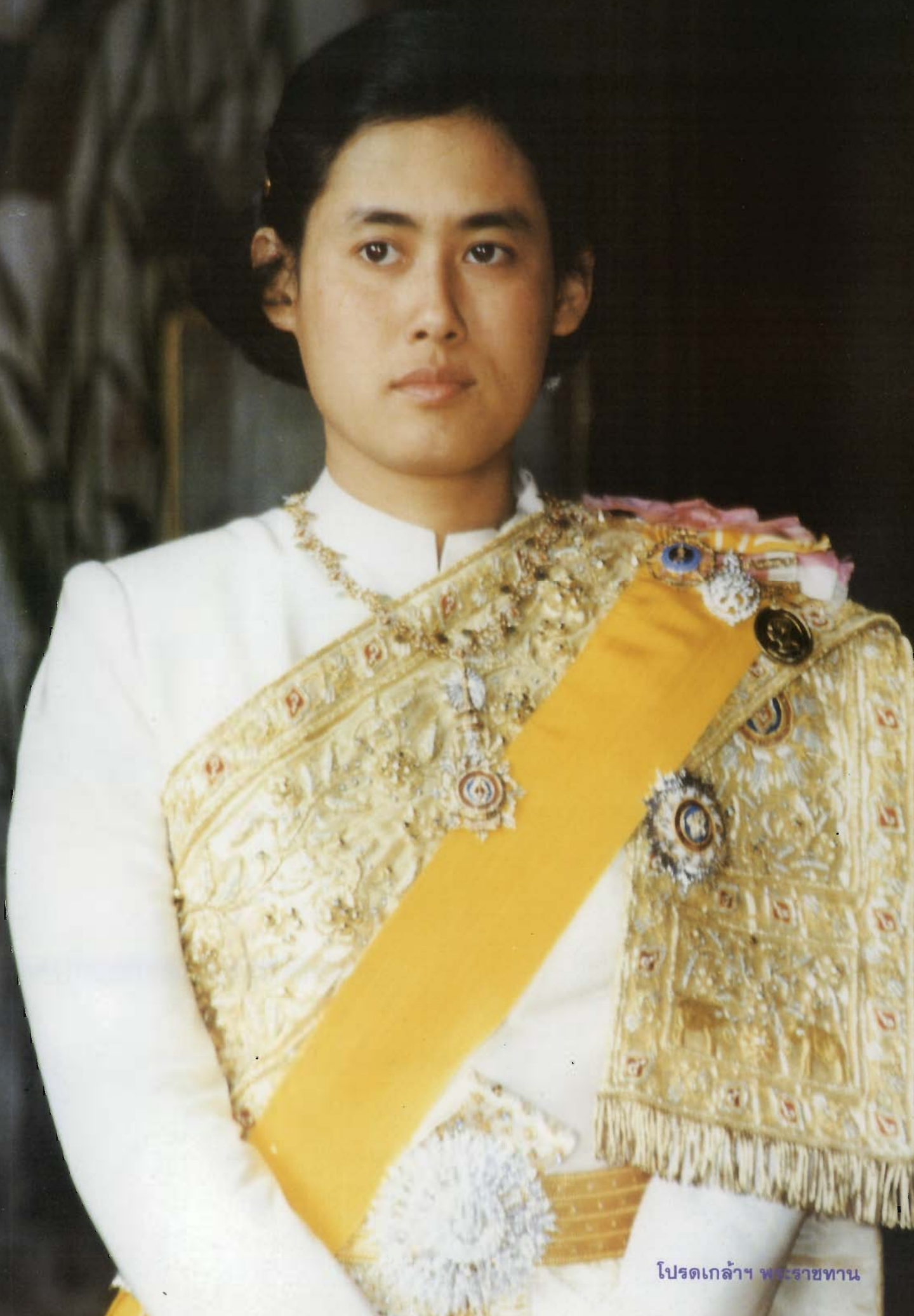
โปรดเกล้าฯ พระราชทาน