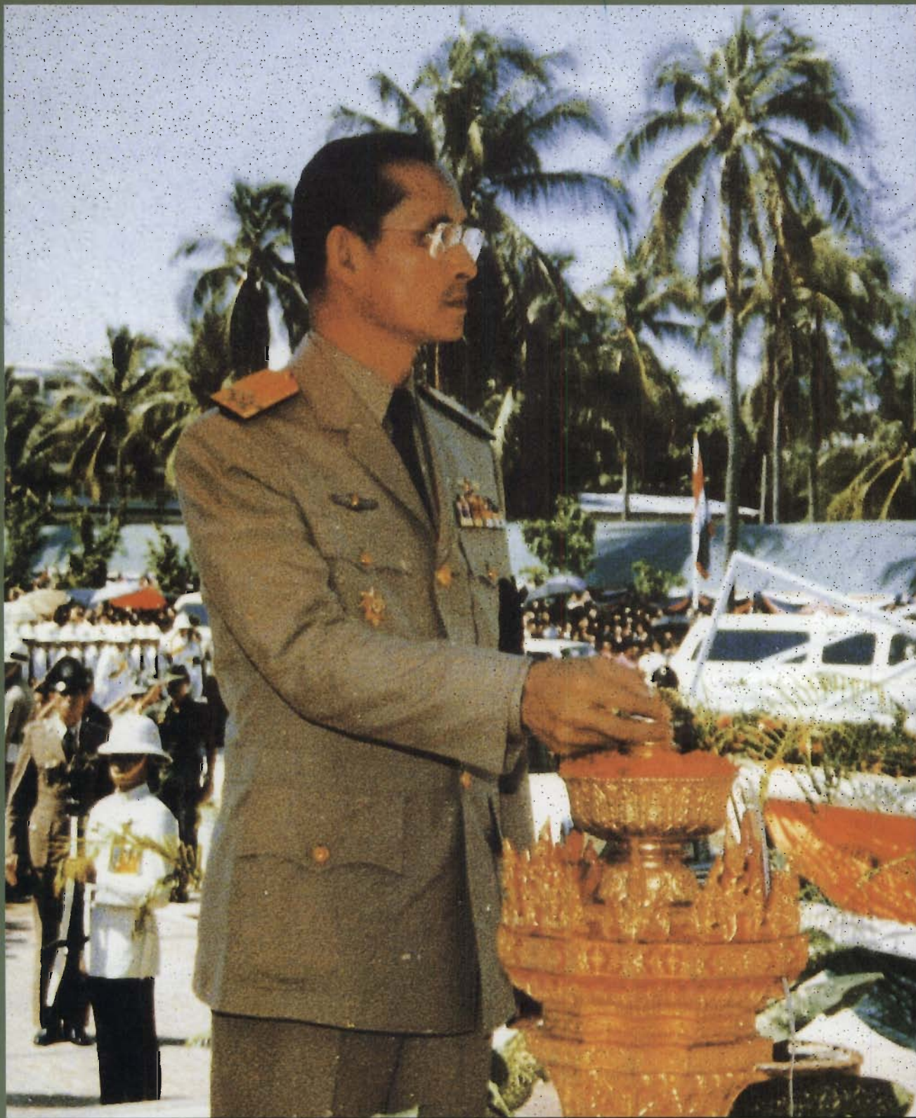
พระบาทสมเด็จพระเจ้าอยู่หัว เสด็จพระราชดำเนินทรงเปิด สถาบันวิทยาศาสตร์ทางทะเล เมื่อวันที่ 24 กรกฎาคม พุทธศักราช 2527