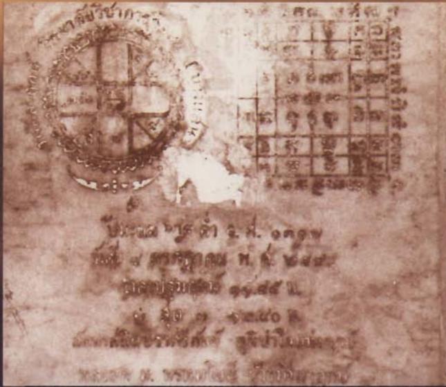
แผ่นศิลาฤกษ์ บรรจุไว้ ณ อาคารอำนวยการ วันศุกร์ที่ 8 กรกฎาคม พุทธศักราช 2498