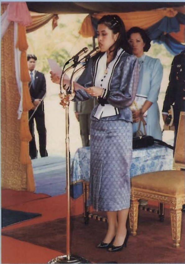
สมเด็จพระเจ้าลูกเธอ เจ้าฟ้าจุฬาภรณวลัยลักษณ์ อัครราชกุมารี ทรงเปิดอาคารคณะพยาบาลศาสตร์ เมื่อวันที่ 12 ธันวาคม พุทธศักราช 2529