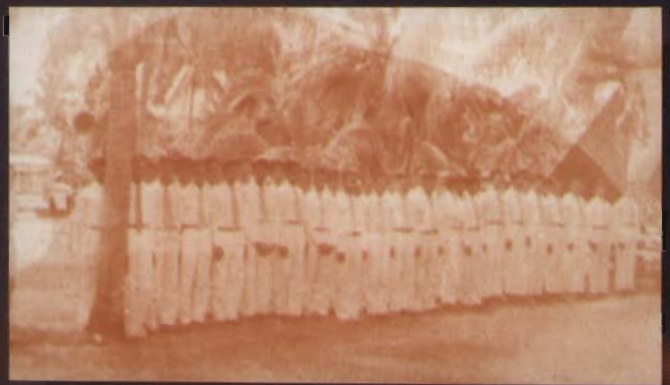
นิสิตชั้นปีที่ 1 เข้าแถวต้อนรับประธานในพิธี

คืนนี้ แสง แสง กนกนาคได้ เป็นวันวิเศษสุด ฯพณฯ ออกทิวทัศน์ในตึก ทั่วทุกชั้นแล้ว ทั่วไทย มีดอกไม้เฉพาะเขตนี้ ส่วนแล้ว ทั่วทั่ว แดนเกษมเป็นพสก ชาติวิเศษสุด ทั่วไทย ทั่วไทย ทั่วไทย ทั่วไทย เพื่อจะได้ศึกษานานาชาติ