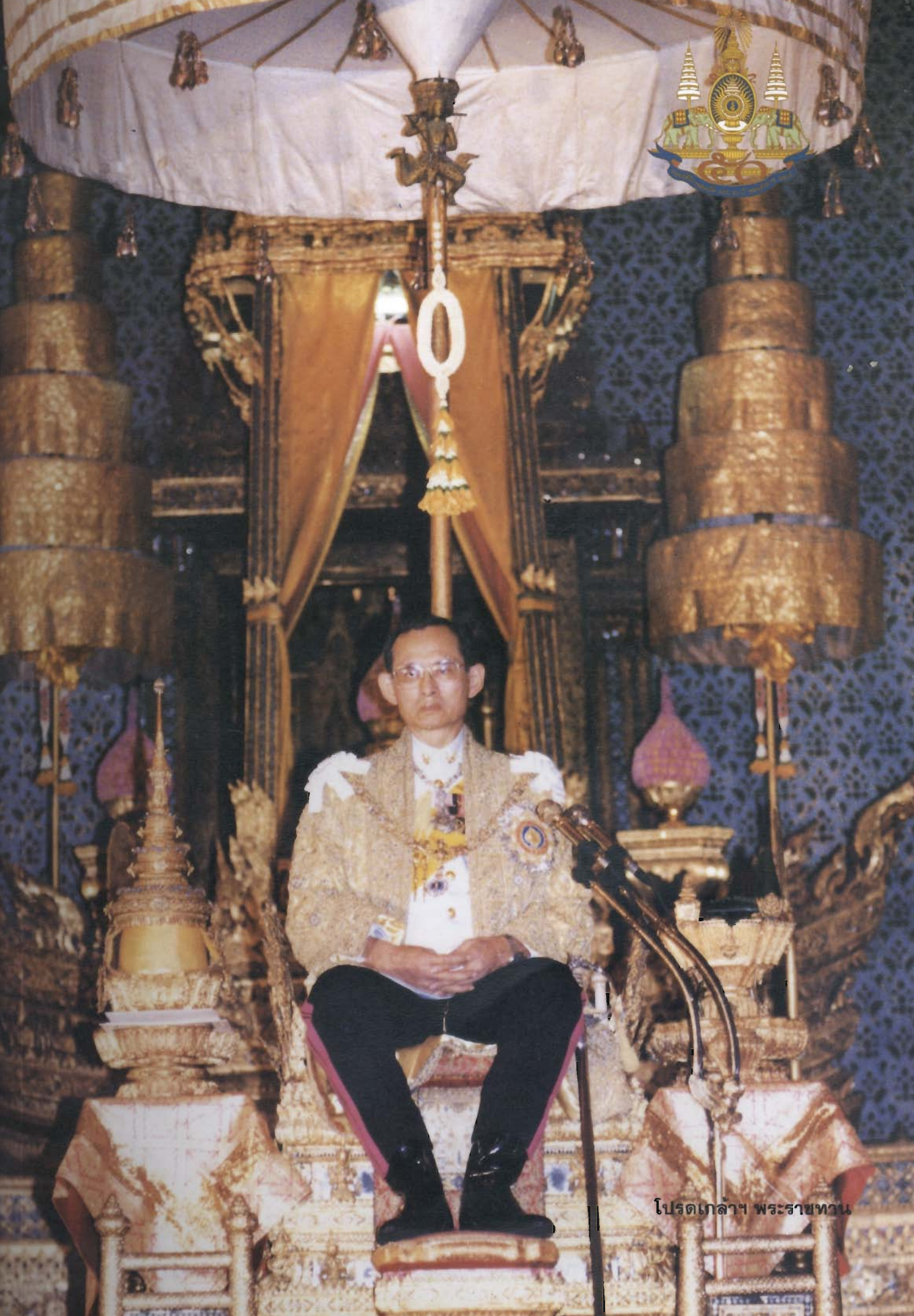
โปรดเกล้าฯ พระราชทาน