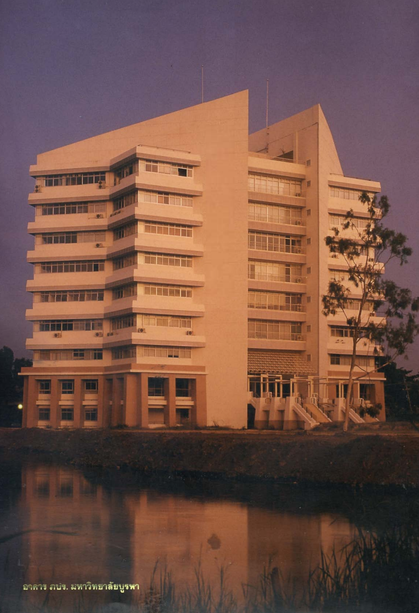
อาคาร สปอ. มหาวิทยาลัยบูรพา