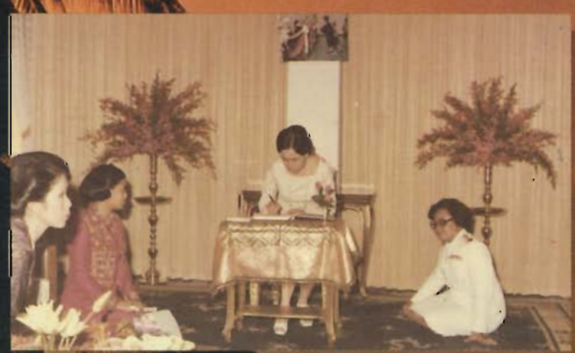
สมเด็จพระนางเจ้าฯ พระบรมราชินีนาถ เสด็จพระราชดำเนินพระราชทานปริญญาบัตร แก่ผู้สำเร็จการศึกษา เมื่อวันที่ 31 มีนาคม พุทธศักราช 2518