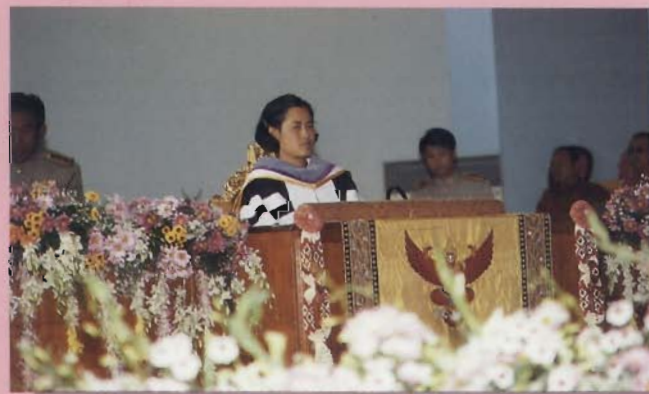
ทรงพระกรุณาโปรดเกล้าฯ ให้สมเด็จพระเทพรัตนราชสุดาฯ สยามบรมราชกุมารี เสด็จพระดำเนินแทนพระองค์ ทรงเปิดอาคาร “มหิตลาธิเบศร์” อาคาร “ศรีนครินทร์” และอาคาร “80 พรรษามหาราชนิ” และพระราชทานปริญญาบัตรแก่บัณฑิตของมหาวิทยาลัยบูรพา ณ หอประชุมมหาวิทยาลัยบูรพา วันที่ 16 มกราคม พ.ศ.2538

ผู้สำเร็จการศึกษา คณาจารย์ และข้าราชการ มหาวิทยาลัยบูรพาจะสืบเนื่องได้ โดยเฉพาะอย่างยิ่ง ผู้สำเร็จการศึกษาที่ได้มีโอกาสเข้ารับพระราชทานปริญญาบัตรจะถือว่าเป็นสิริมงคลแก่ตนเองและวงศ์ตระกูลต่อไปชั่วกาลนาน ส่วนผู้ที่ยังอยู่ในระหว่างการศึกษาลำเรียนต่างก็มานะพยายามศึกษาลำเรียนโดยไม่เห็นแก่ความเหน็ดเหนื่อยยากบากบั่นฟันฝ่าอุปสรรคทั้งปวงเพื่อจะได้เข้าเฝ้ารับพระราชทานปริญญาบัตรเช่นเดียวกับผู้สำเร็จการศึกษารุ่นก่อนๆ