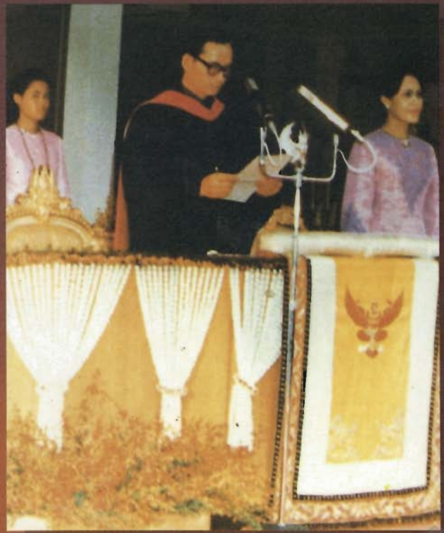
เสด็จพระราชดำเนิน พร้อมด้วยสมเด็จพระนางเจ้าพระบรมราชินีนาถ สมเด็จพระเทพรัตนราชสุดาฯ สยามบรมราชกุมารี และ สมเด็จพระเจ้าลูกเธอ เจ้าฟ้าจุฬาภรณวลัยลักษณ์ เพื่อพระราชทานปริญญาบัตรแก่บัณฑิต ณ หอสมุดมหาวิทยาลัยบูรพา (มหาวิทยาลัยศรีนครินทรวิโรฒ บางแสน) วันที่ 30 มิถุนายน พ.ศ.2519

ดังในปีพุทธศักราช 2518 พระบาทสมเด็จพระเจ้าอยู่หัว ทรงพระกรุณาโปรดเกล้าโปรดกระหม่อม ให้สมเด็จพระนางเจ้าฯ พระบรมราชินีนาถ เสด็จพระราชดำเนินแทนพระองค์ทรงเป็นประธานในพิธีพระราชทานปริญญาบัตรแก่ผู้สำเร็จการศึกษามหาวิทยาลัยศรีนครินทรวิโรฒ บางแสน ณ มหาวิทยาลัยศรีนครินทรวิโรฒ บางแสน เมื่อวันที่ 31 มีนาคม พุทธศักราช 2518 การเสด็จพระราชดำเนินในครั้งนี้ สมเด็จพระเทพรัตนราชสุดาฯ สยามบรมราชกุมารี เสด็จพระราชดำเนินด้วยนอกจากพระราชกิจในการพระราชทานปริญญาบัตรแล้ว สมเด็จพระนางเจ้าฯ พระบรมราชินีนาถ ยังพระราชทานธงประจำรุ่นแก่ลูกเสือชาวบ้านด้วย