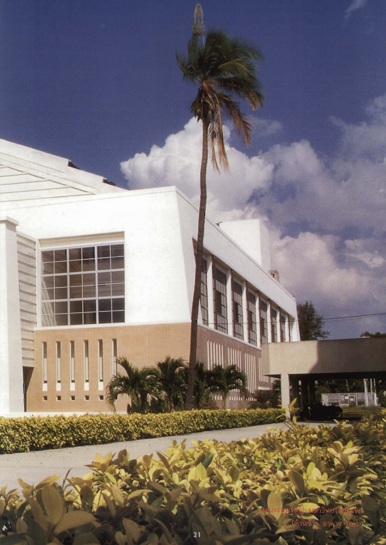
หอประชุมใหญ่ มหาวิทยาลัยบูรพา (ด้านข้าง อาคาร กบง.)