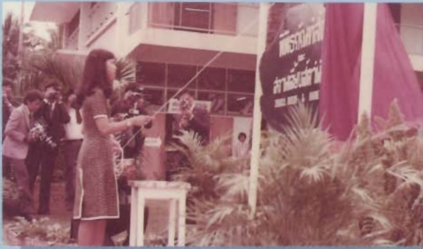
สมเด็จพระเจ้าลูกเธอ เจ้าฟ้าจุฬาภรณวลัยลักษณ์ อัครราชกุมารี ทรงเปิดพิพิธภัณฑสัตว์และสถานเลี้ยงสัตว์น้ำเค็ม เมื่อวันที่ 26 ตุลาคม พุทธศักราช 2519