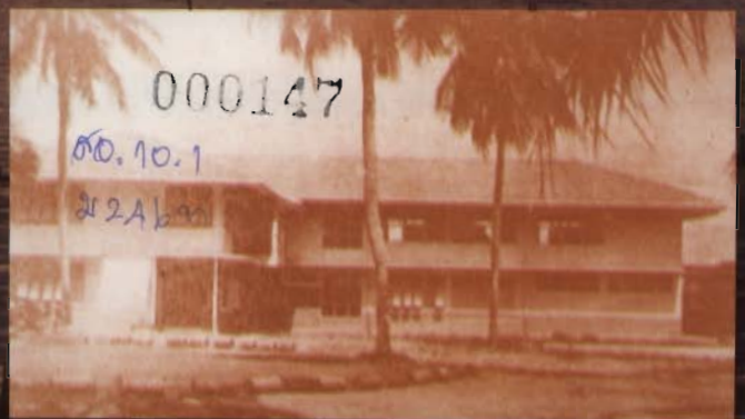
อาคารอำนวยการ หลังแรก พุทธศักราช ๒๔๕๗

เลือกจำเพาะพระมาตีที่บางแสน ต้องวางแผนกะการเป็นงานใหญ่ วางศิลาฤกษ์ถ่วงตรงชายไพร เพื่อจะได้ศึกษานานาชาติ