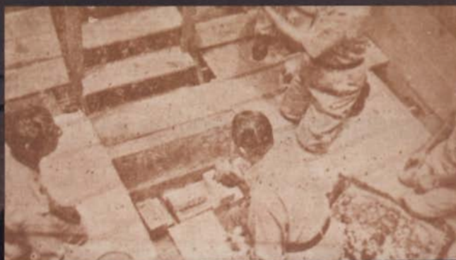
วางศิลาฤกษ์ วิทยาลัยวิชาการศึกษา บางแสน

มณฑลพิธีที่วางศิลาฤกษ์ ได้แก่ บริเวณห้อง รับแขกของงานประชาสัมพันธ์ ตึกอำนวยการปัจจุบัน โดยขุดลึกลงไปดินประมาณ 2 เมตร กว้างยาวด้าน ละ 5 เมตร ภายในกรุด้วยไม้ มีบันไดลง บริเวณโดย รอบประดับด้วยราชวัตร ฉัตร ธง ครอบถ้วน แผ่นศิลา ฤกษ์ทำด้วยหินอ่อน มีข้อความจารึกดังต่อไปนี้