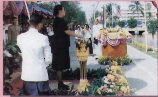
ทรงพระกรุณาโปรดเกล้าฯ ให้สมเด็จพระเทพรัตนราชสุดาฯ สยามบรมราชกุมารี เสด็จพระดำเนินแทนพระองค์ ทรงเปิดอาคาร “เทพรัตนราชสุดา” และพระราชทานปริญญาบัตรแก่บัณฑิตของ มหาวิทยาลัยบูรพา ณ หอประชุมมหาวิทยาลัยบูรพา ธันวาคม 2538