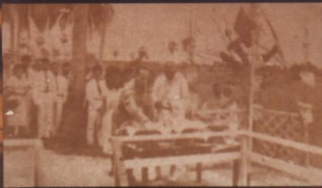
ฯพณฯ พลเอกมังกร พรหมโยธี ทำพิธีวางศิลาฤกษ์ ณ อาคาร อำนวยการ