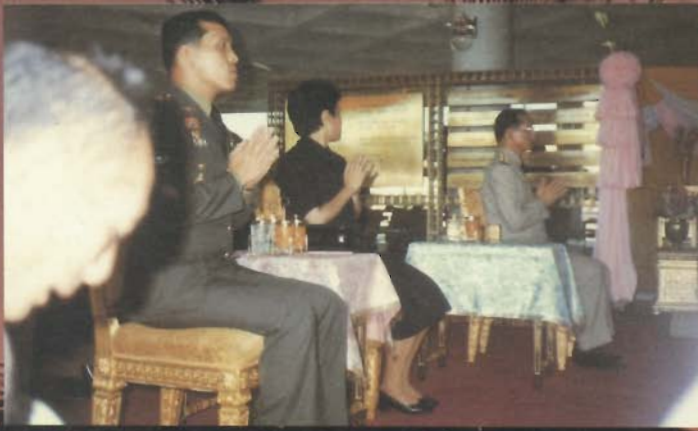
เสด็จพระราชดำเนินพร้อมด้วยสมเด็จพระบรมโอรสาธิราชสยามมกุฎราชกุมาร สมเด็จพระเทพรัตนราชสุดาฯ สยามบรมราชกุมารี ทรงเปิดสถาบันวิทยาศาสตร์ทางทะเล มหาวิทยาลัยบูรพา (มหาวิทยาลัยศรีนครินทรวิโรฒ บางแสน) และพระราชทานปริญญาบัตรแก่บัณฑิตของมหาวิทยาลัย ณ สถาบันวิทยาศาสตร์ทางทะเล 24 กรกฎาคม 2527