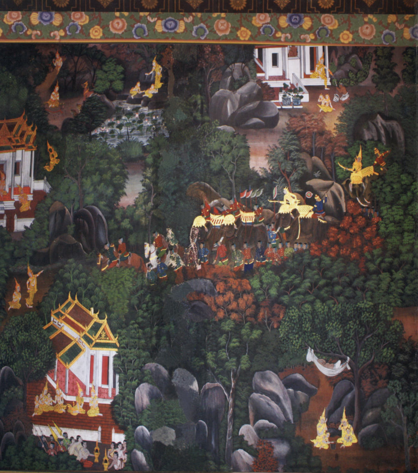
ภาพจิตรกรรมฝาผนัง ณ อุโบสถวัดพนัญเชิงวรวิหาร จังหวัดพระนครศรีอยุธยา