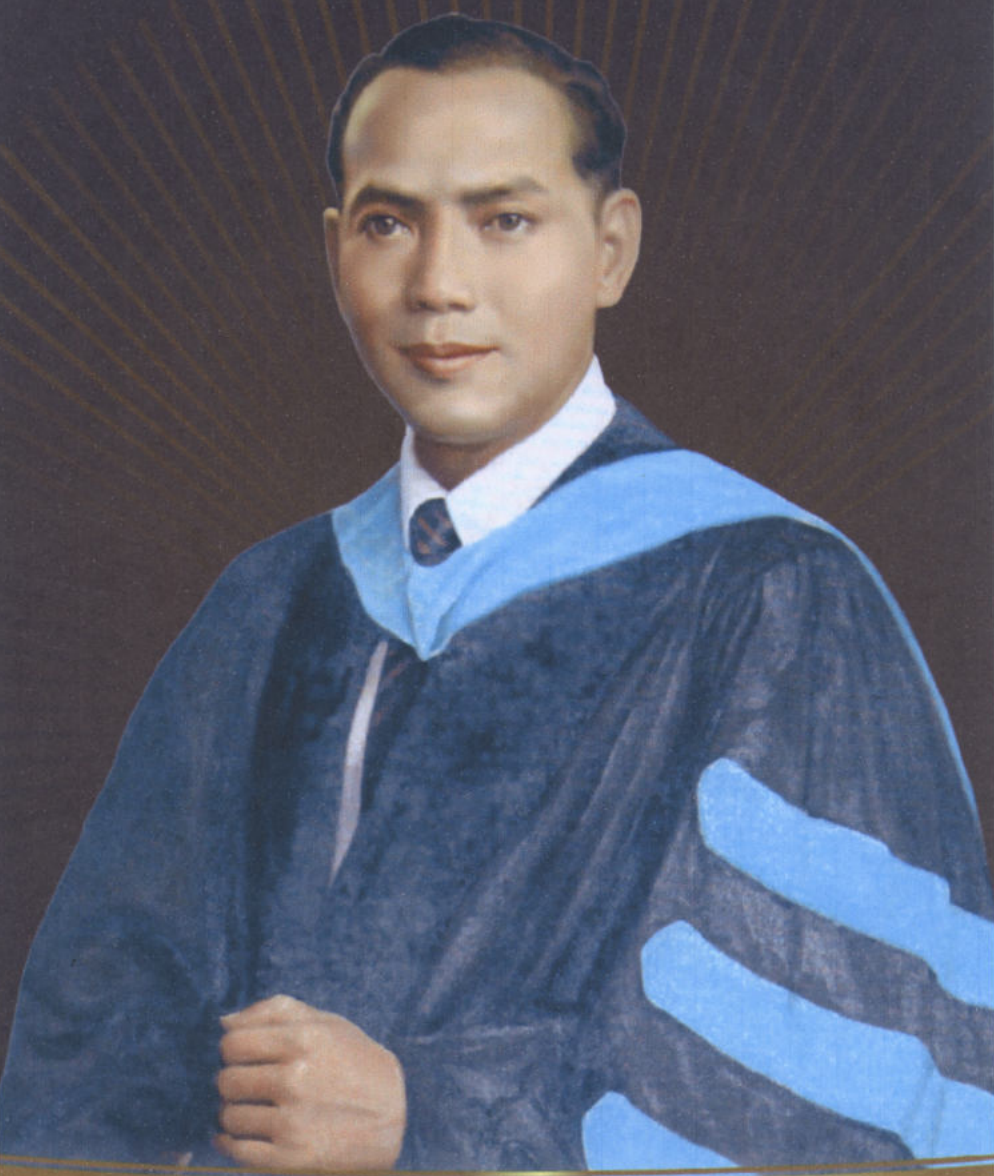
ศ.ดร.ธำรง บัวศรี