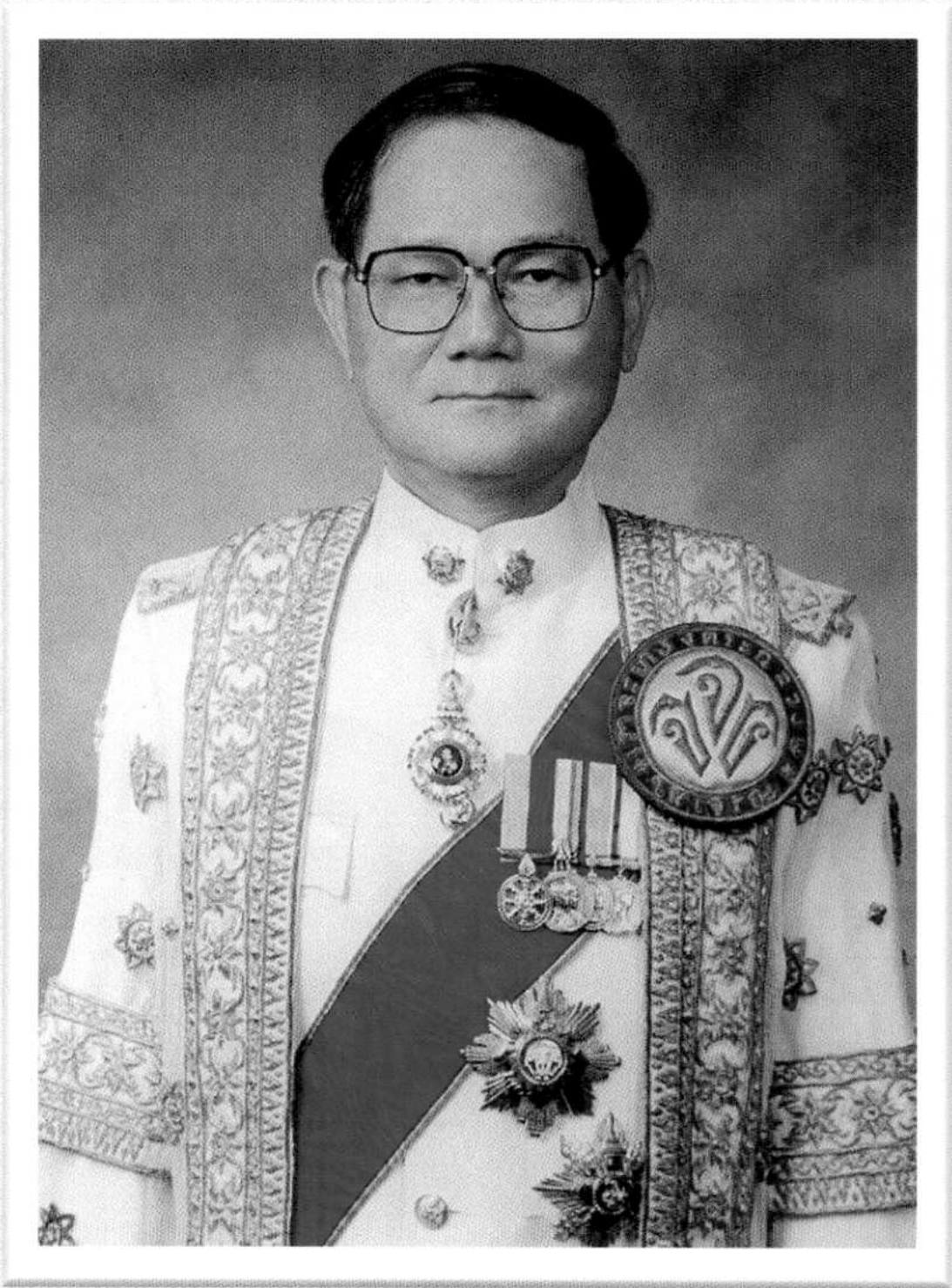
นายมีชัย ฤชุพันธุ์ นายกสภามหาวิทยาลัยบูรพา